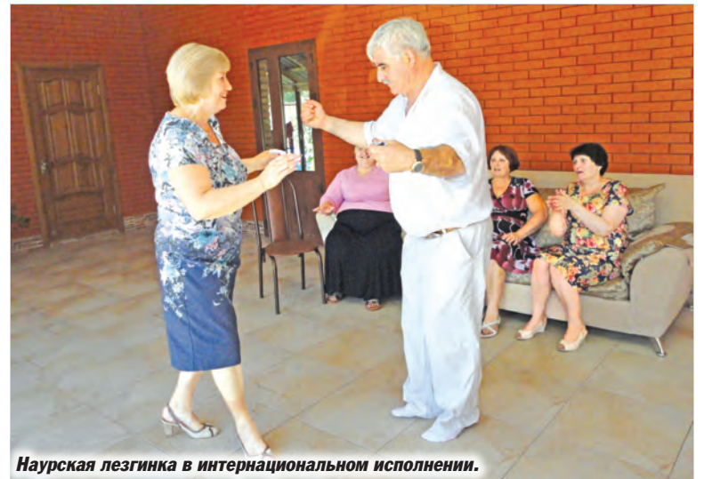
Наурская лезгинка в интернациональном исполнении.

Калиновцы, вне зависимости от национальности, приглашали в гости. Мне любезно предоставили возможность побывать в родном доме. Здесь давно живут другие люди, да