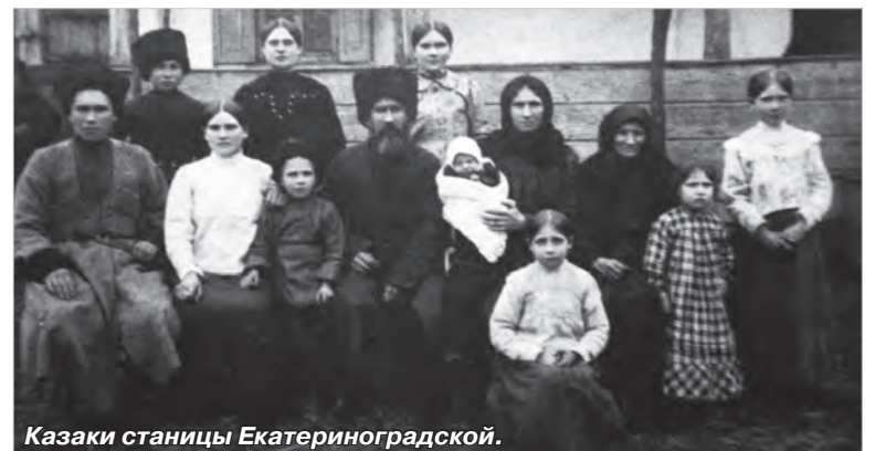
Казачи станицы Екатериноградской.

Здесь вообще можно немало островков старины найти. Например, вот этот турлучный дом, запечатленный на снимке. Видите, он не весь огорожен забором. Крыльцо выходит прямо на улицу.