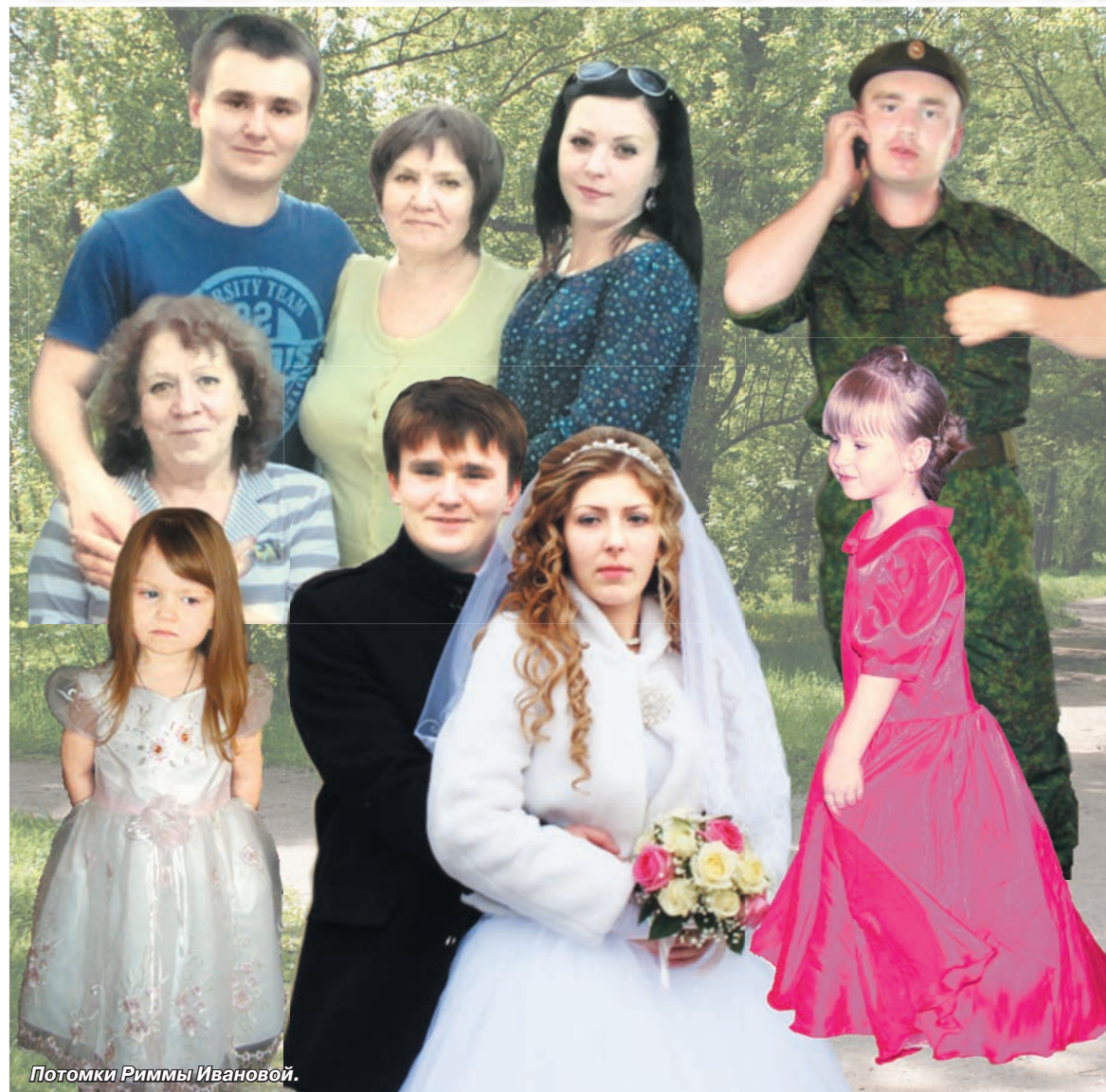
Потомки Риммы Ивановой.