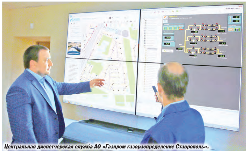
Центральная диспетчерская служба АО «Газпром газораспределение Ставрополь».

становительные работы, счёт за которые порой достигает нескольких десятков или даже сотен тысяч рублей.