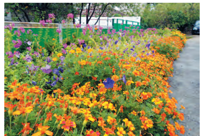
Над выпуском работала Наталья АРДАЛИНА.