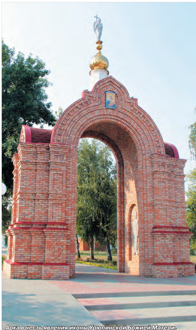
Арка в честь явления иконы Урюпинской Божией Матери.