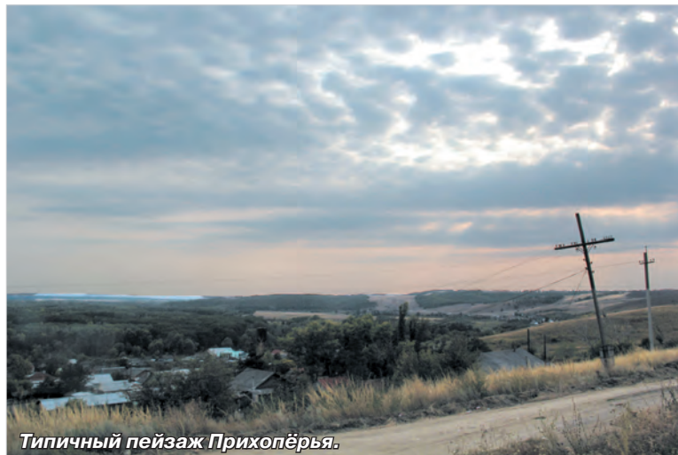
Типичный пейзаж Прихопёрья.

Многие века через земли Хоперские тянулся с юга на север Астраханский шлях. В XIII веке по нему шли орды хана Батыя завоевывать новые земли. Но не всегда этот путь использовался в