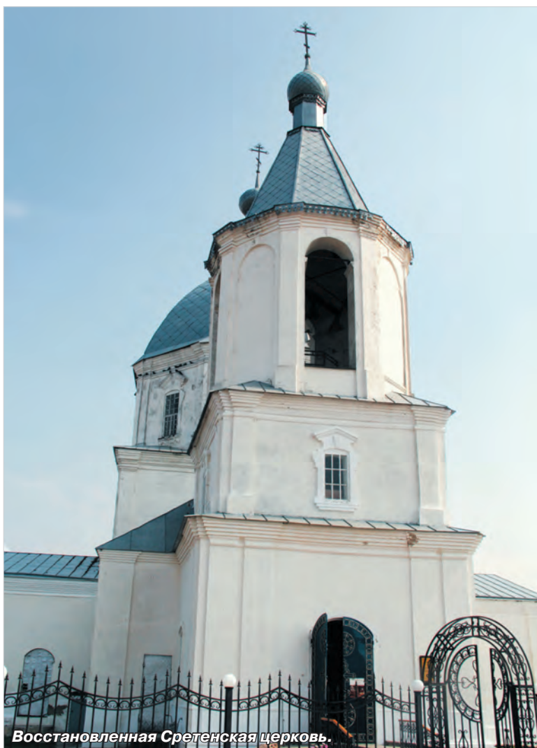
Восстановленная Сретенская церковь.