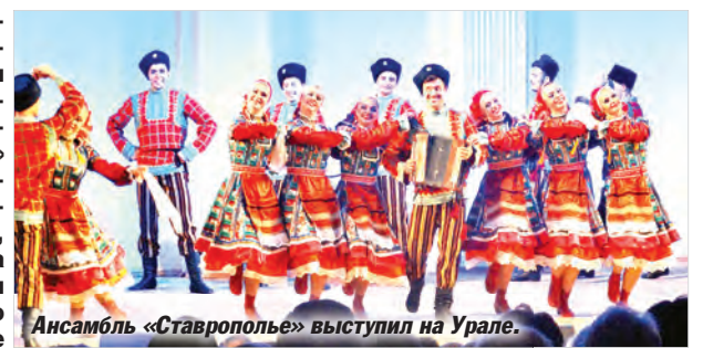
Ансамбль «Ставрополье» выступил на Урале.

В конце августа с большим успехом и неизменными аншлагами прошли концерты Государственного казачьего ансамбля песни и танца «Ставрополье» на Урале. Жители Оренбурга, Челябинска, Миасса, Кургана, Кыштыма, Златоуста и Екатеринбург стали первыми зрителями грандиозного творческого проекта «Память сильнее времени», посвященного