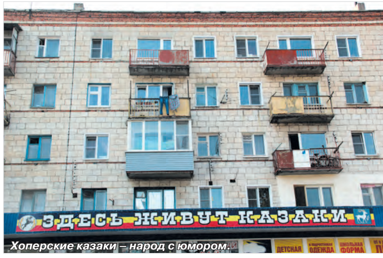
Хоперские казаки — народ с юмором.