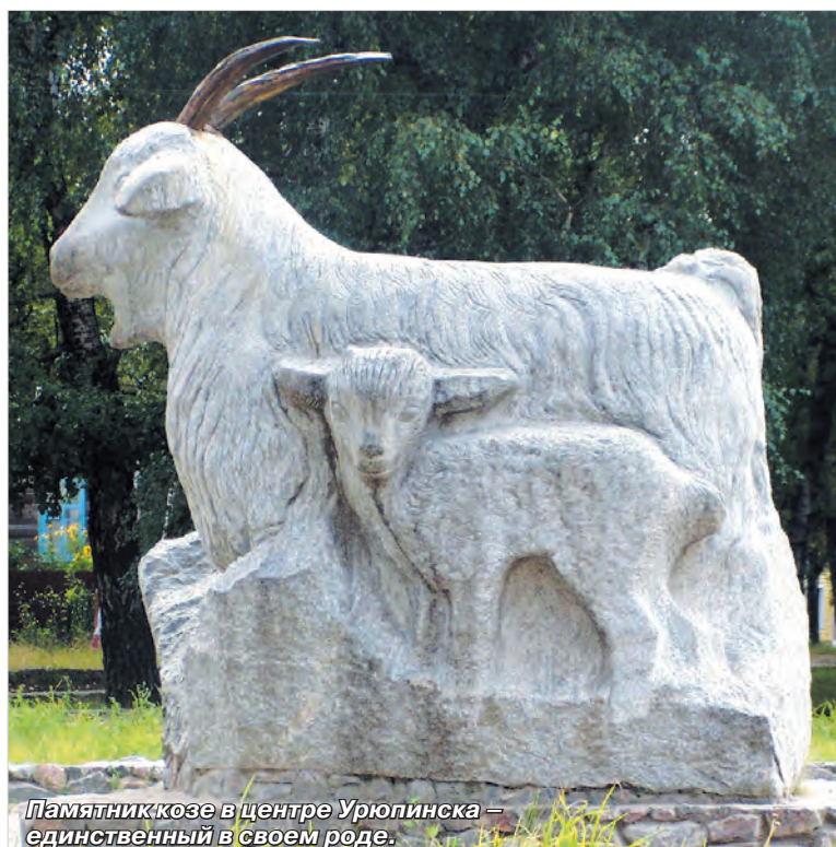
Памятник козе в центре Урюпинска — единственный в своем роде.