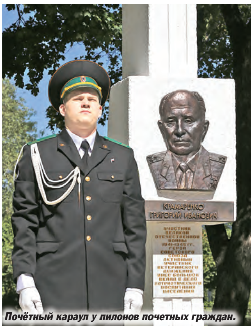
Почётный караул у пилонов почетных граждан.