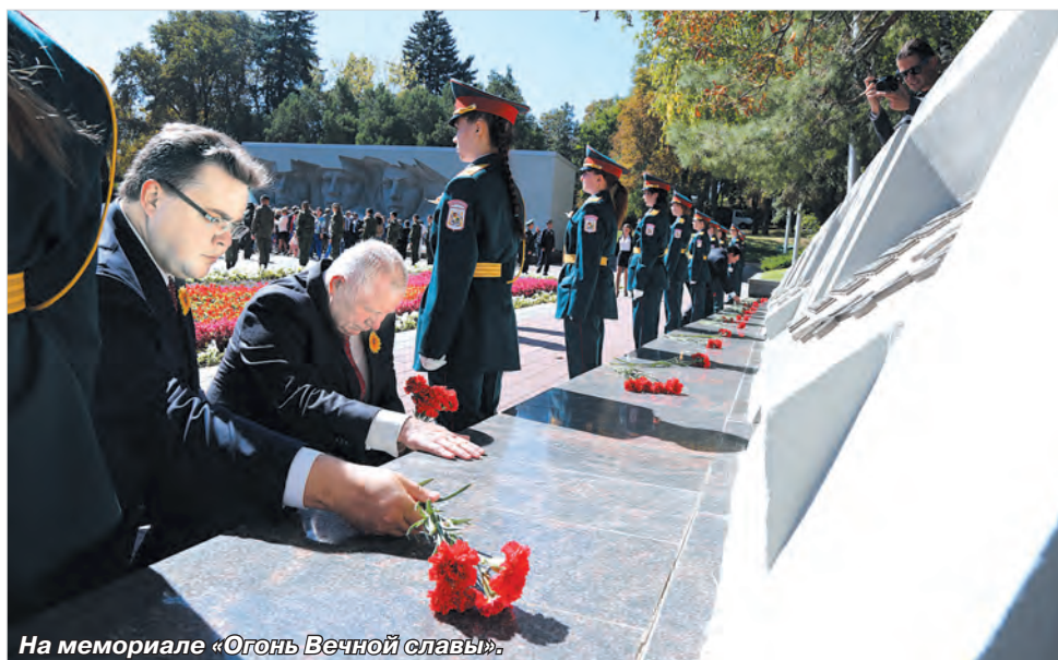
На мемориале «Огонь Вечной славы».

Концерт под открытым небом лучше всякой рекламы привлекал всё новых и новых зрителей. Поражали разнообразием вкусов и ароматов блюда национальных кухонь на фестивале кулинарного искусства. Вовсю бурлила жизнь на национальных подворьях. Мастера художественных промыслов, умельцы из разных уголков Северного Кавказа делились своими секретами.