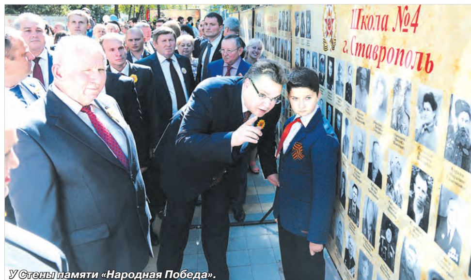
У Стены памяти «Народная Победа».