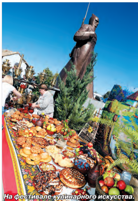
На фестивале кулинарного искусства.