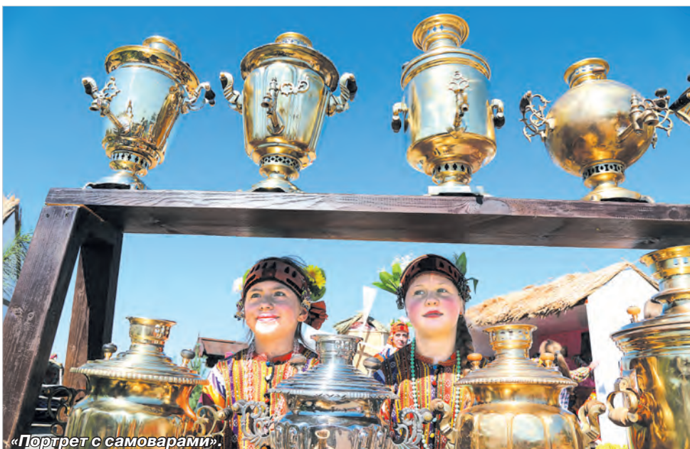
«Портрет с самоварами».