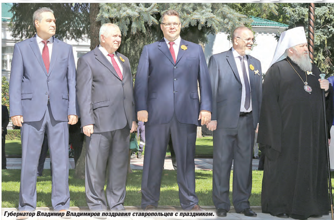
Губернатор Владимир Владимиров поздравил ставропольцев с праздником.

«Край золотых сердец» - под таким девизом проходил в этом году День Ставропольского края, объединённый с Днём города Ставрополя. Украшенный цветами, флагами, яркими праздничными баннерами, Град Креста с самого утра в субботу делился своим солнечным настроением с жителями и гостями краевого центра.