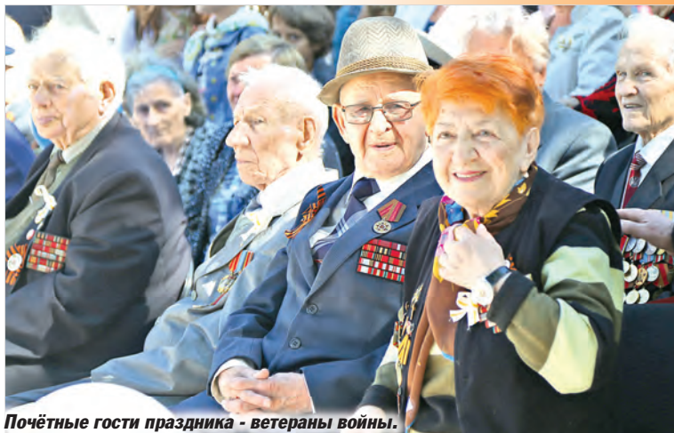
Почётные гости праздника - ветераны войны.