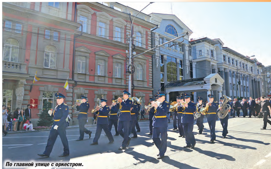
По главной улице с оркестром.