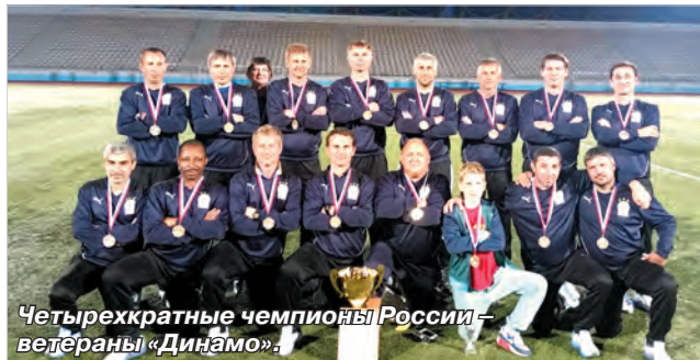
Четырехкратные чемпионы России – ветераны «Динамо».

Блестяще в Новокуйбышевске, где проходил финальный турнир чемпионата России по футболу среди ветеранов в возрасте не моложе 40 лет, выступило ставропольское «Динамо».