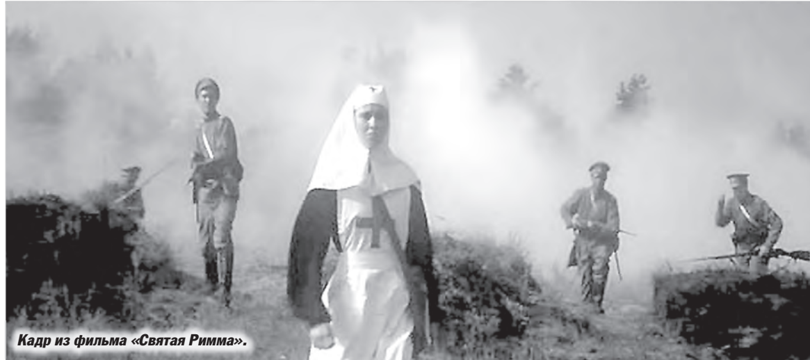
Кадр из фильма «Святая Римма».

лежского асессора, небогатой, но дружной. На первых «позициях» семья была одна: приносить пользу людям и быть верными право-