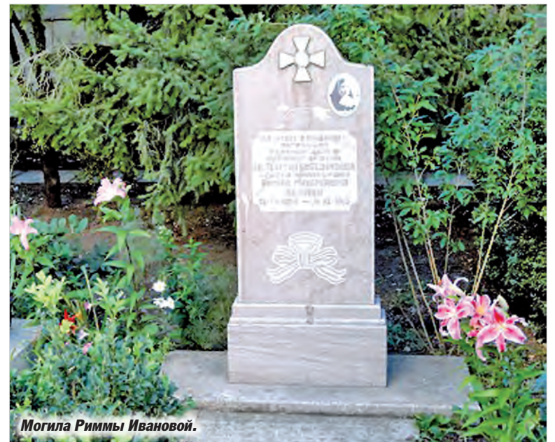
Могила Риммы Ивановой.