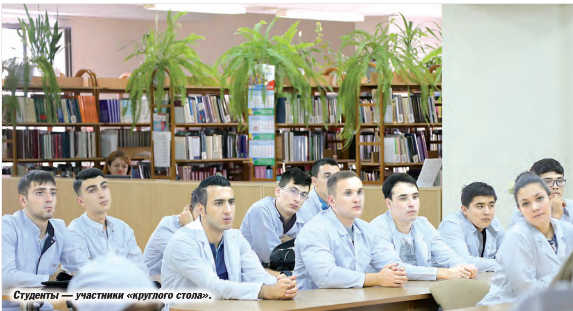
Студенты — участники «круглого стола».