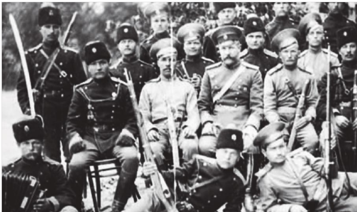
Отряд отважных погранцов.