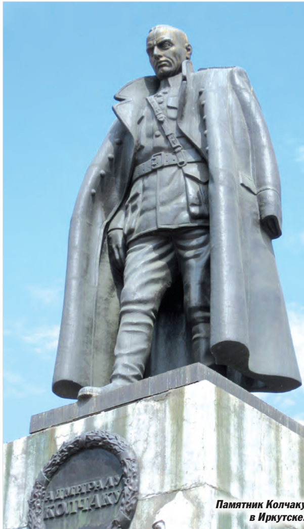
Памятник Колчаку в Иркутске.

Их вывели на берег речки Ушаковки, его и Пепеляева, члена правительства Колчака. Пепеляев все время плакал: ему было непонятно: его-то за что? Колчак шевелил губами. Как будто тихо напевал любимый романс