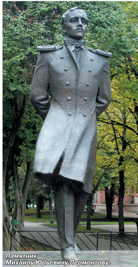
Памятник Михаилу Юрьевичу Лермонтову.

Генеральной прокуратуры РФ памятник в 2012 году был восстановлен (хоть и на другом месте), не принесло скульптору полного удовлетворения. Он до сих пор не может простить варварского отношения к его творению, олицетворявшему собой народную память.