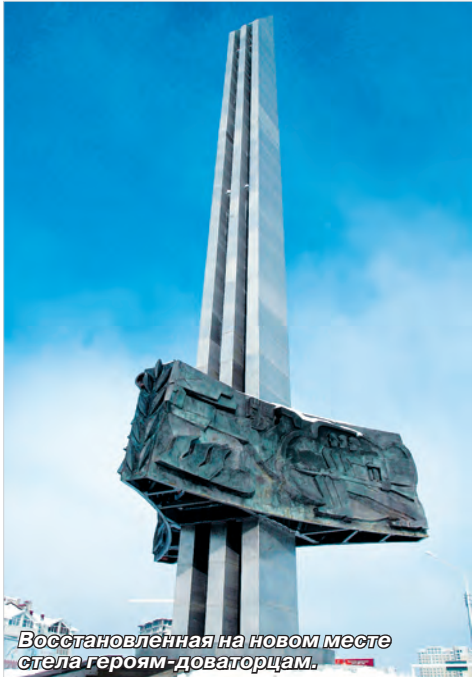
Восстановленная на новом месте стела героям-доваторцам.

8 мая 1975 года в торжественной обстановке был открыт, наверное, самый знаменитый монумент скульптора Санжарова – стела героям-доваторцам.