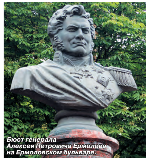
Бюст генерала Алексея Петровича Ермолова на Ермоловском бульваре.