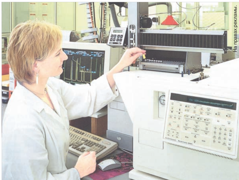
На правах рекламы.

ников сделан на продуктах, компенсирующих дефицит различных витаминов, а также железа, кальция, магния и цинка в организме. В сегменте железосодержащих тоников главную роль играет Флорадики Ликвид Айрон Формула, который может помочь не только при железодефицитной анемии, но и при быстрой утомляемости, усталости, ломкости ногтей и волос, когда содержание железа в крови приближается к нижней границе нормы. В его состав, кроме главного компонента - хорошо усваиваемого в кишечнике железа, добавлены витамин С (из плодов шиповника), тиамин, витамины В6 и В12, водные экстракты пивных дрожжей, моркови, крапивы, шпината, фенхеля, пырея, водорослей и каркаде. Здесь же соки груши, винограда. Черной смородины, ежевики, вишни, апельсина, свеклы; добавлены мед и экстракт проростков пшеницы. Он полезен в любом возрасте при повышенной потребности в железе (вегетарианцам, при инфекциях, при хронических заболеваниях, спортсменам, беременным и кормящим женщинам, пожилым людям и т.п.).