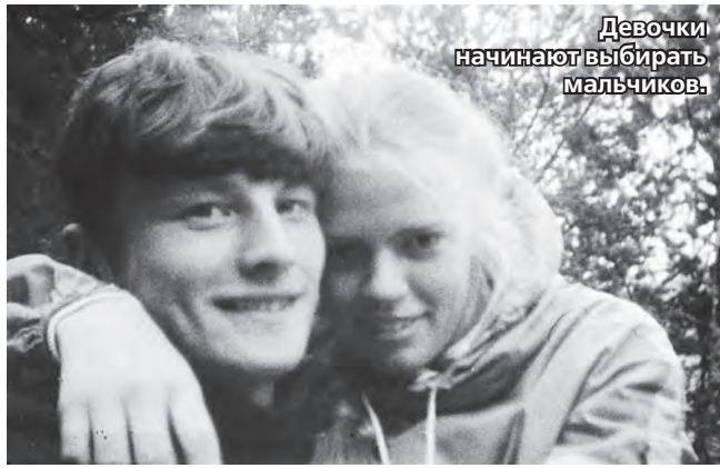
Девочки начинают выбирать мальчиков.