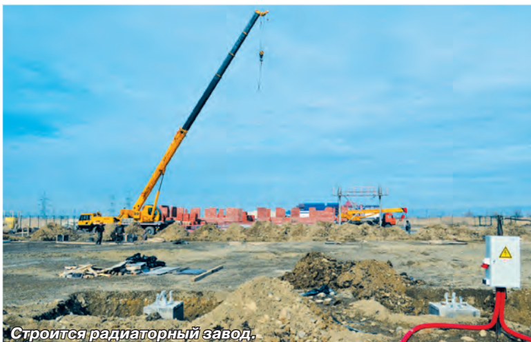
Строится радиаторный завод.