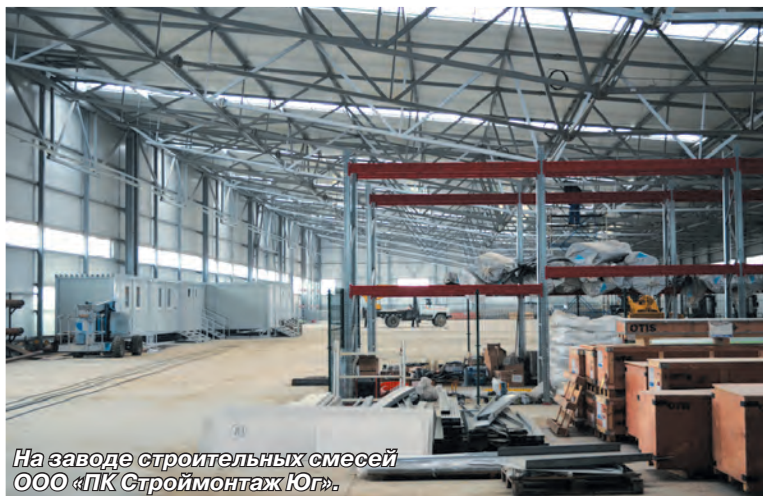
На заводе строительных смесей ООО «ПК Строймонтаж Юг».