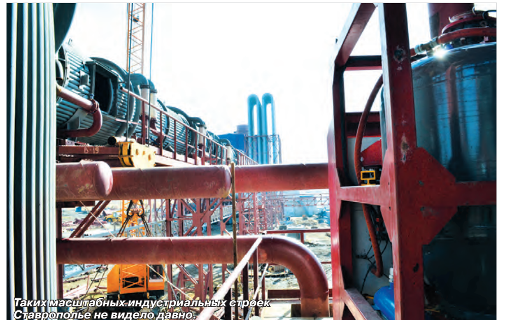
Таких масштабных индустриальных строек Ставрополье не видело давно.