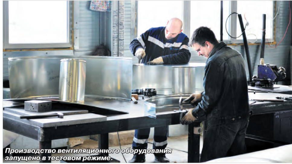
Производство вентиляционного оборудования запущено в тестовом режиме.