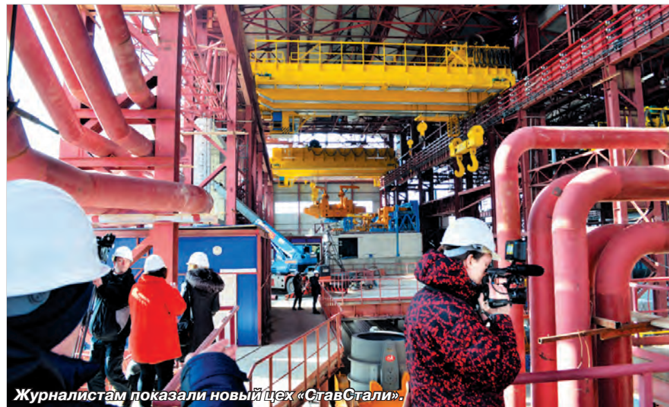
Журналистам показали новый цех «СтавСтали».

Опять же, Виталий Хоценко признался, что инвесторы не стоят в очереди в наши индустриальные парки и выбирать особенно не приходится. Разумеется, каждый проект проходит тщательную экспертизу, но в нынешней ситуации краевым властям