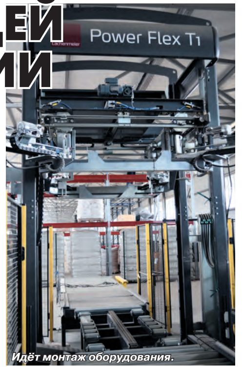
Идёт монтаж оборудования.