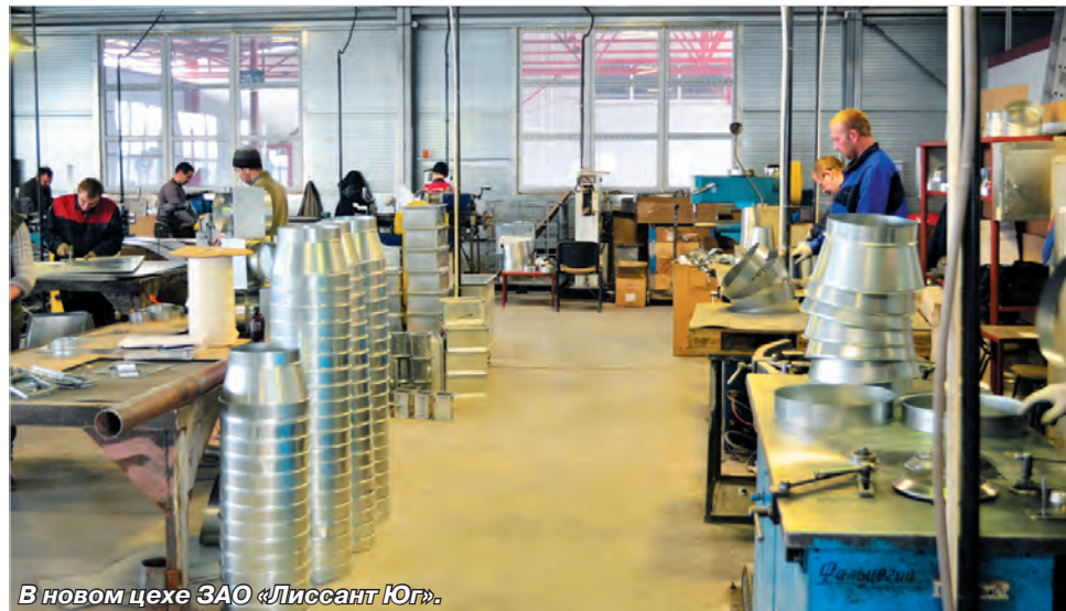
В новом цехе ЗАО «Лиссант Юг».