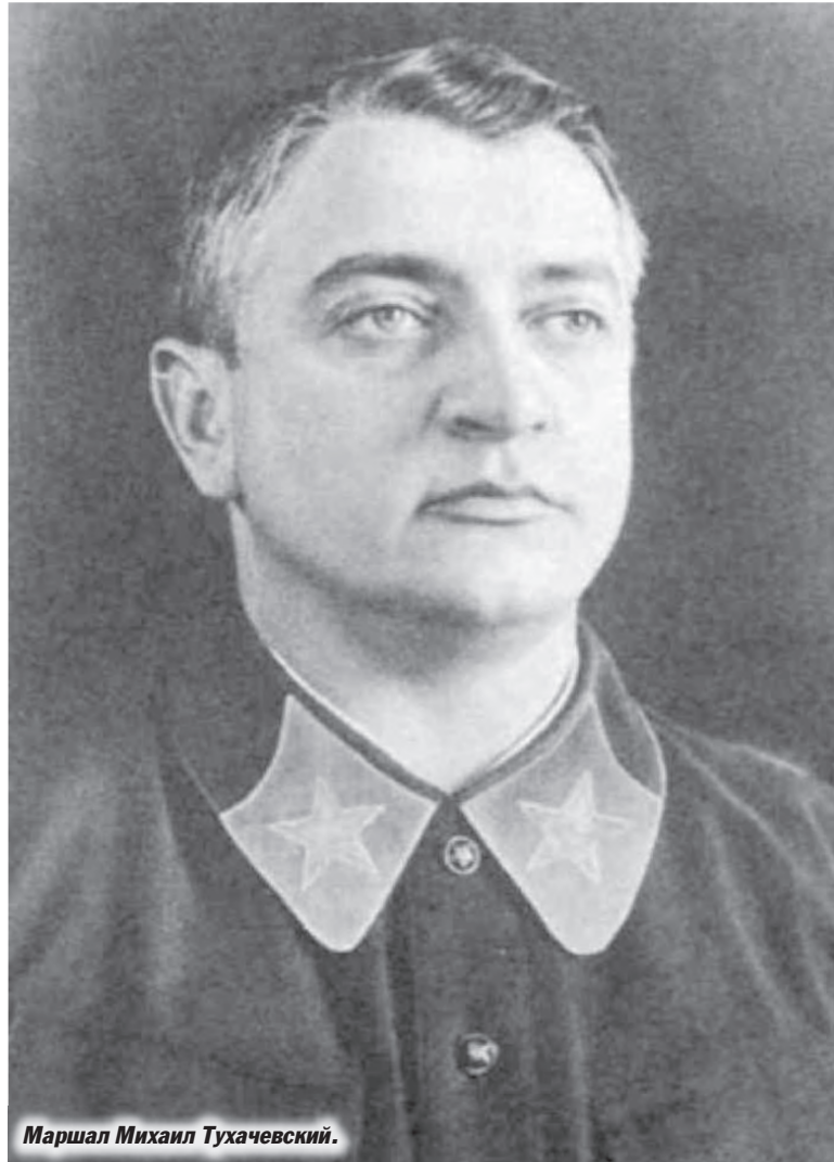
Маршал Михаил Тухачевский.

Московского района обороны. Как раз тогда он «гонялся», и безуспешно, за Колчаком. От Капеля, соратника Колчака, его Первая Красная армия терпит тяжелое поражение... Но неудачи не подкосили молодого командира. Тогда за Симбирск шли бои, и Тухачевский в начале сентября подготовил и провёл силами армии успешную операцию по взятию Симбирска. Впервые он проявляет полководческие качества. Военные историки отмечают «глубоко продуманный план операции, смелое и быстрое сосредоточение основных сил армии на решающем направлении, своевременное доведение задач до войск, а также решительные, умелые и инициативные их действия». Впервые в Гражданской войне один полк (5-й Курский Симбирской дивизии) перевезён в район сосредоточения на автомашинах.