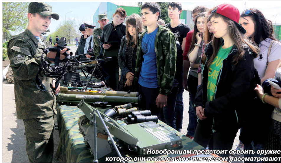
Новобранцам предстоит освоить оружие, которое они пока только с интересом рассматривают.