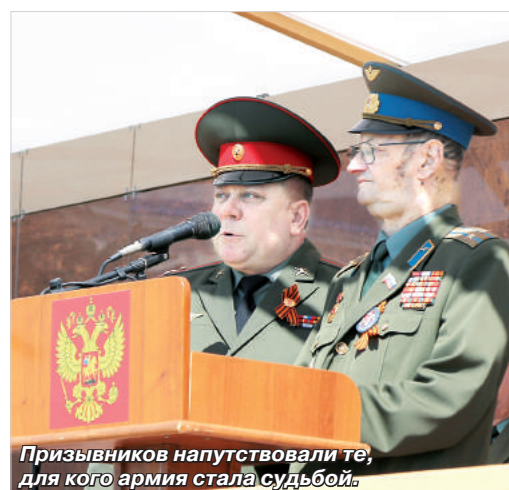
Призывников напутствовали те, для кого армия стала судьбой.