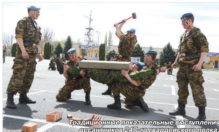
Традиционные показательные выступления десантников 247-го гвардейского полка.

Елена ПАВЛОВА.