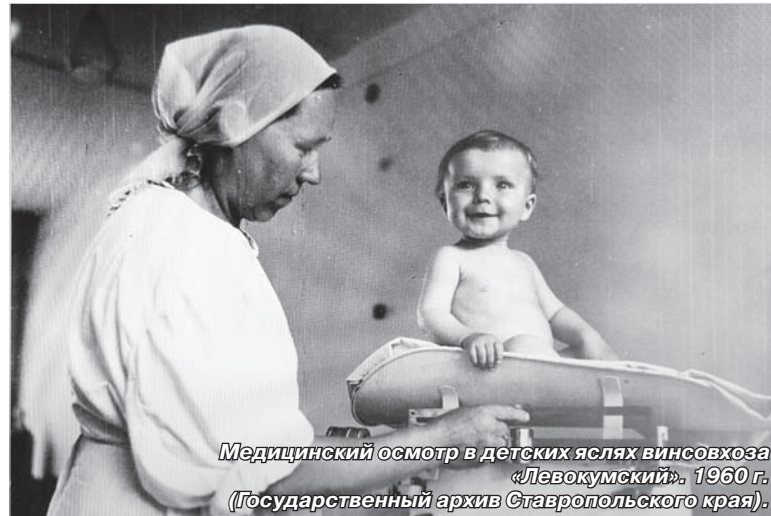
Медицинский осмотр в детских яслях винсовхоза «Левокумский». 1960 г. (Государственный архив Ставропольского края).

В экспозиции представлен Свод законов Российской империи, в котором отражены основные положения семейной политики в России в XIX – начале XX века. В этот период традиционные семейные ценности опирались на христианские понятия. Законы о браке повторяли евангельские заповеди, брак считался таинством. Это отражено в проповедях священников о браке и почитании родителей. Семьи были многодетные и многопоколенные, о