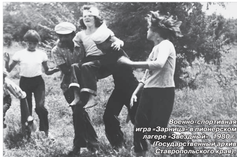
Военно-спортивная игра «Зарница» в пионерском лагере «Звёздный». 1980 г.