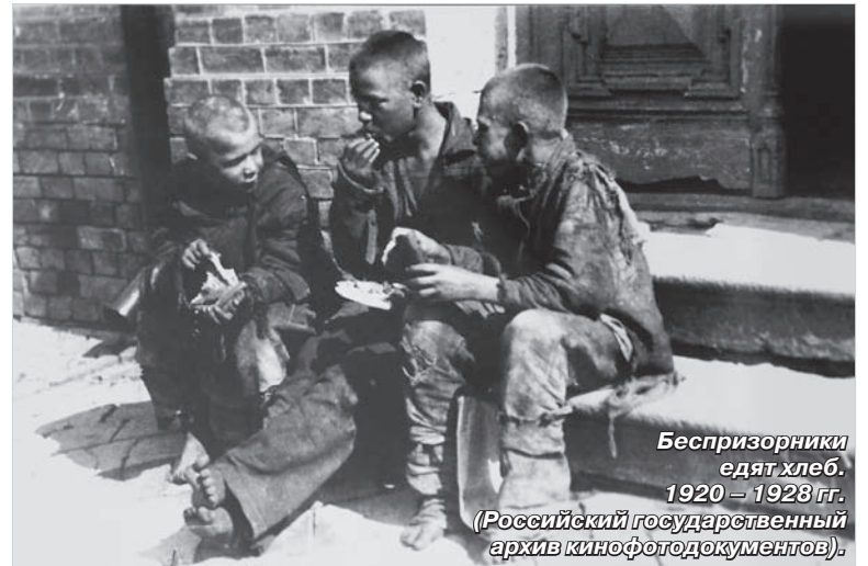
Беспризорники едят хлеб. 1920 – 1928 гг. (Российский государственный архив кинофотодокументов).