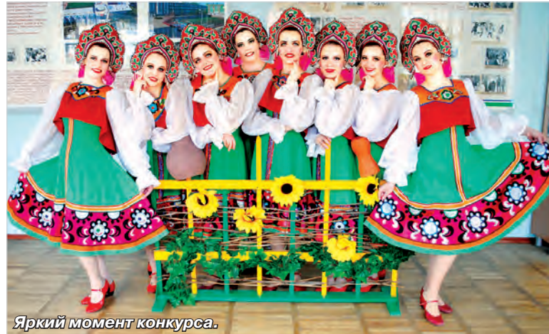
Яркий момент конкурса.

Душевная атмосфера и богатая жанровая программа стали залогом успеха всего конкурса. Выступления педагогов были необычайно красочны, эмоционально насыщены и даже – фееричны. Все участники показали высокий уровень профессионального и творческого мастерства. Их идеи были реализованы в ярких танцевальных постановках «Моя Рос-