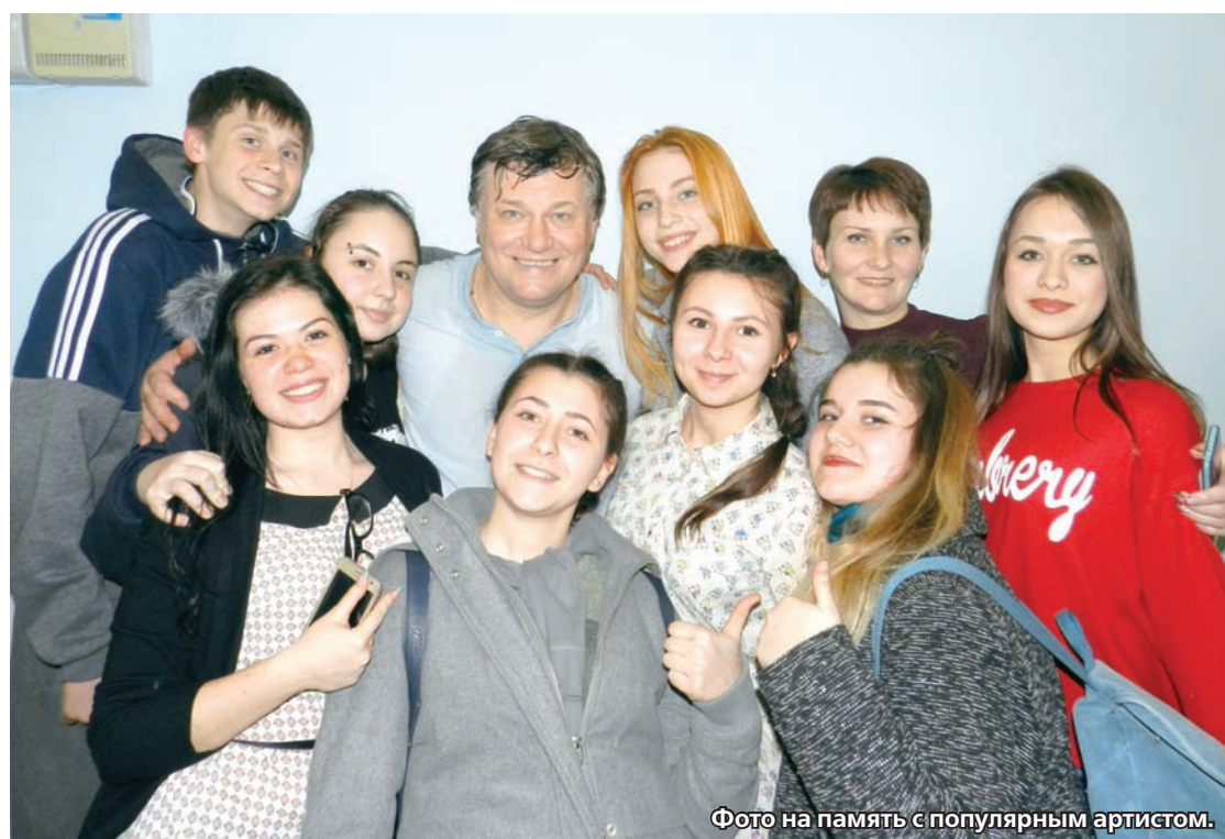
Фото на память с популярным артистом.