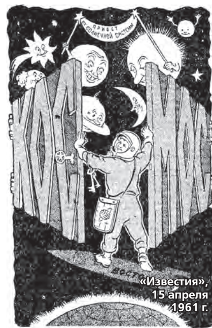
«ИЗВЕСТИЯ», 15 апреля 1961 г.

ней открыт любому желающему. Поэтому нам сложно представить, что испытали 12 апреля 1961 года жители планеты, когда узнали о первом космическом полете корабля-спутника «Восток» с человеком на борту. «Вечерний Ставрополь» берет на себя смелость рассказать о реакции на это событие глазами печатной прессы того времени.