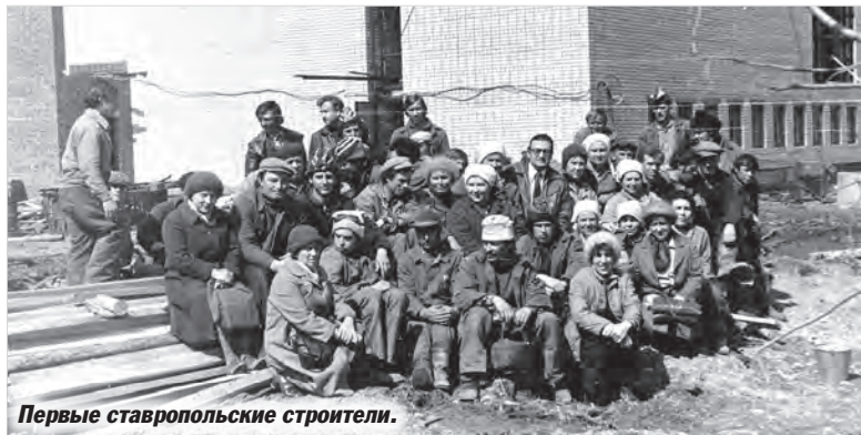
Первые ставропольские строители.

струсил, обратно не уехал... Все ребята остались на строительстве... Ребята с гитарами, девчата с нехитрым скарбом селились в эти деревянные бараки. Ничего не боялись, воду носили, готовили на печках. И выдержали! Появилось у нас и электричество, и вода, холодная, правда, ну да и такой рады были...»