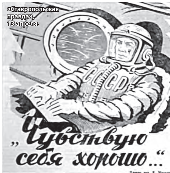
«Ставропольская правда», 13 апреля.

Это была шутка, конечно. И парни тоже отшучивались!»