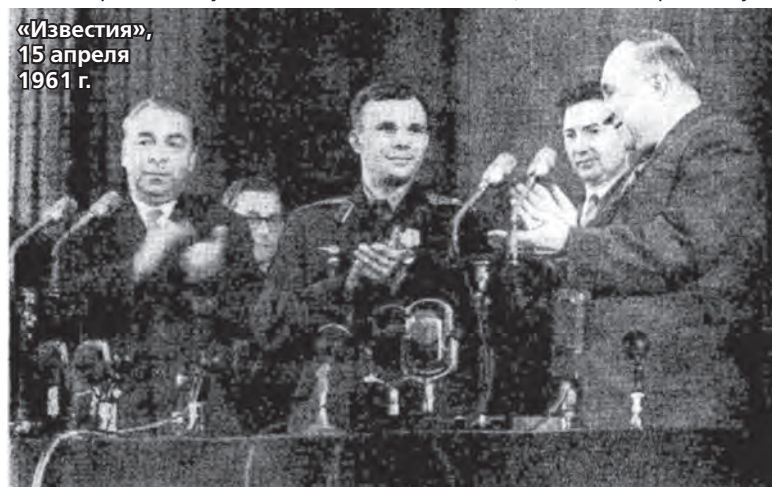
В празднично-пресс-конференции, посвященной успешному осуществлению первого в мире космического полета советского человека на корабле-спутнике «Восток».