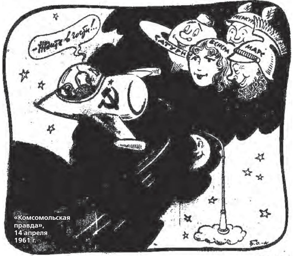
«Комсомольская правда», 14 апреля 1961 г.