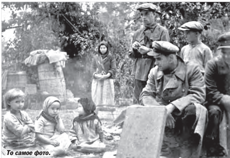
То самое фото.

Одежды у меня не было никакой, кроме летнего платья, и однажды надзирательница или кто там она была, кинула мне какое-то тряпье, все в маленьких дырочках. И там была кровь, которую мы совсем не боялись. Каждый день