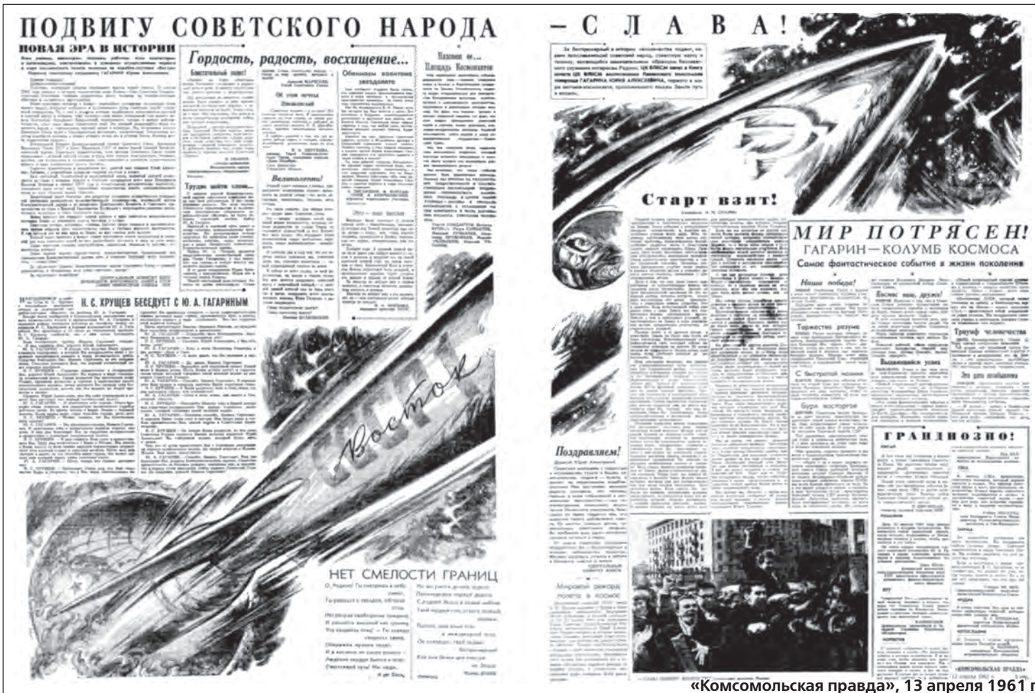
«Комсомольская правда», 13 апреля 1961 г.

Почти с первых дней полета в газетах стали появляться заметки ученых о перспективах, которые открылись перед человечеством после полета Гагарина в космос. По мелочам не разменивались и пророчили межпланетные полеты и колонизацию других миров уже через несколько десятилетий. Строились гипотезы о том, какие формы жизни могут обитать на Марсе и Венере, ведь тогда еще не знали, что на планете-двойнике Земли адские условия, а на планете бога войны — безжизненная замерзшая пустыня. Но были и более сдержанные прогнозы: