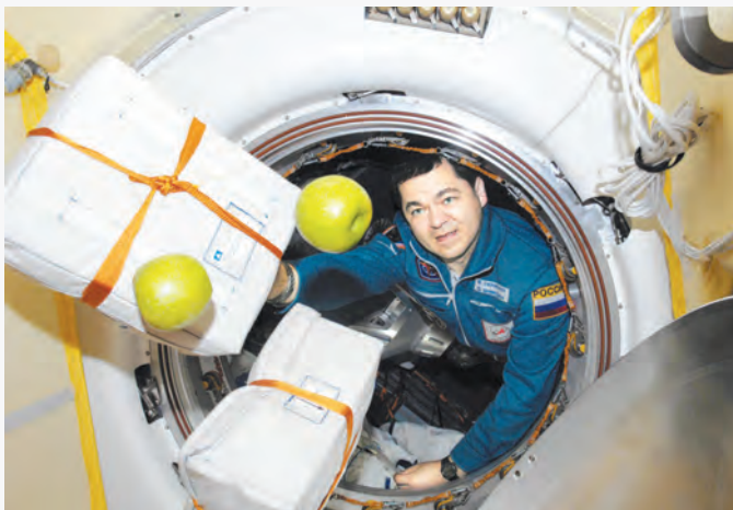
Южная оконечность Африки с высоты Международной космической станции. (Фотография космонавта Олега Скрипочки. 5 апреля 2016).

Не многие жители Ставрополя знают, что прямо сейчас на борту Международной космической станции в качестве бортинженера корабля «Союз ТМА-20М» находится наш земляк, уроженец Невинномысска, Олег Иванович Скрипочка.