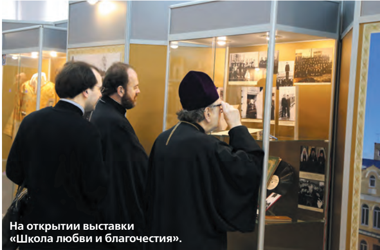
На открытии выставки «Школа любви и благочестия».

В день памяти святителя Игнатия Брянчанинова в краевом центре завершились торжества, посвященные 170-летию Ставропольской духовной семинарии. На праздничные мероприятия в Ставрополь прибыли многочисленные почетные гости, в том числе архиереи Русской Православной Церкви - выпускники этого одного из старейших на Северном Кавказе учебных заведений.