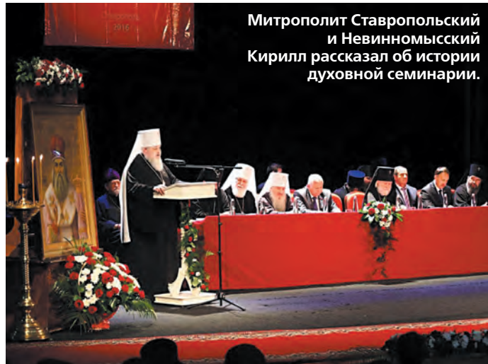
Митрополит Ставропольский и Невинномысский Кирилл рассказал об истории духовной семинарии.