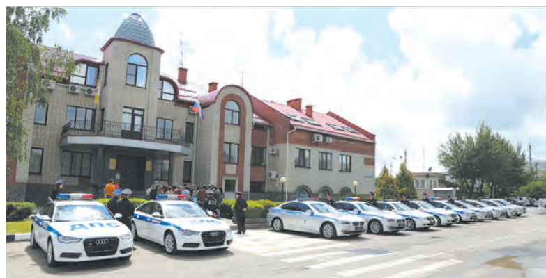
Спецвзвод оснащен автомобилями с повышенными динамическими характеристиками.

Наталья АРДАЛИНА.