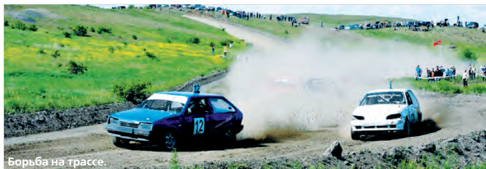
Борьба на трассе.

В городе Гуково состоялся розыгрыш открытого Кубка Ростовской области по автокроссу, в котором участвовали более 60 спортсменов со всей страны.