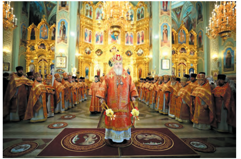
Сонм архиереев Русской Православной Церкви совершили Божественную литургию в Казанском кафедральном соборе.

В рамках юбилейных торжеств состоялись встречи профессора Московской духовной академии и семинарии, выдающегося