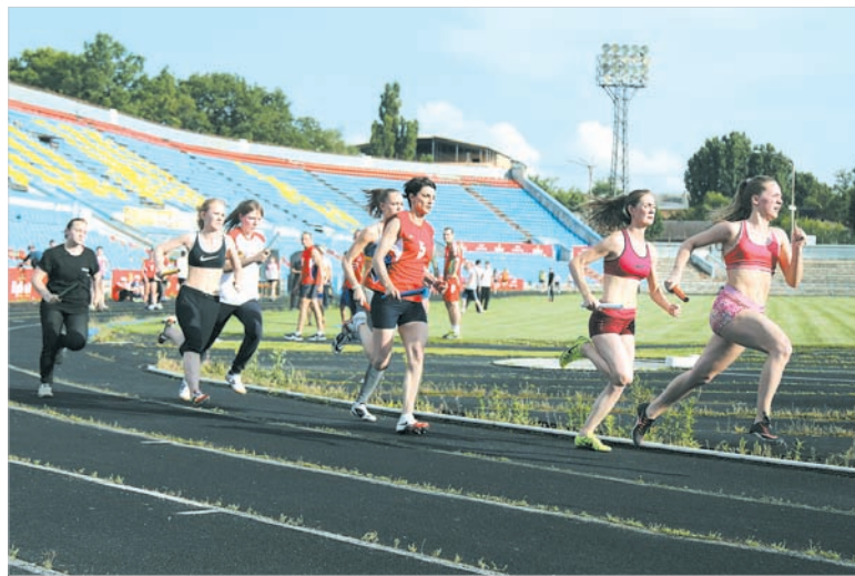
Легкоатлетки на дистанции.