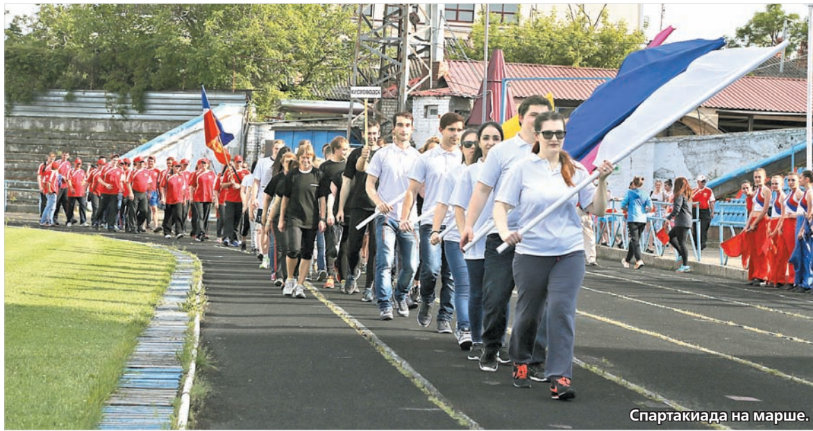
Спартакиада на марше.

А вот пятигорчане и их соседи из Ессентуков, как говорится, пре-