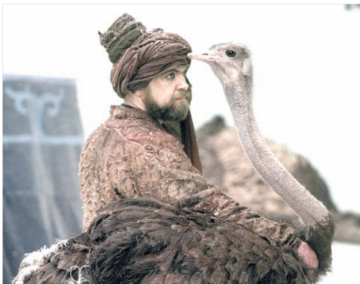
Тот самый страус, который создал проблемы съемочной группе.

Поскольку понятно, что реальных костюмов с того времени не сохранилось (а если бы и сохранились - никакой музей их киношникам бы не уступил), все, что носят в фильме герои, отшивалось на актеров индивидуально в специальных костюмерных. Костюмерам пришлось объездить и различные «барахолки», и антикварные магазины в поисках вещей, которые можно представить как предметы того времени. И в результате кое-какие аутентичные аксессуаров все же были подобраны. А какие-то пришлось делать вручную художникам, «подсматривая» в музеях и исторических архивах тех времен, что же носили мужчины и женщины в то время на Руси и в стане ее врага.