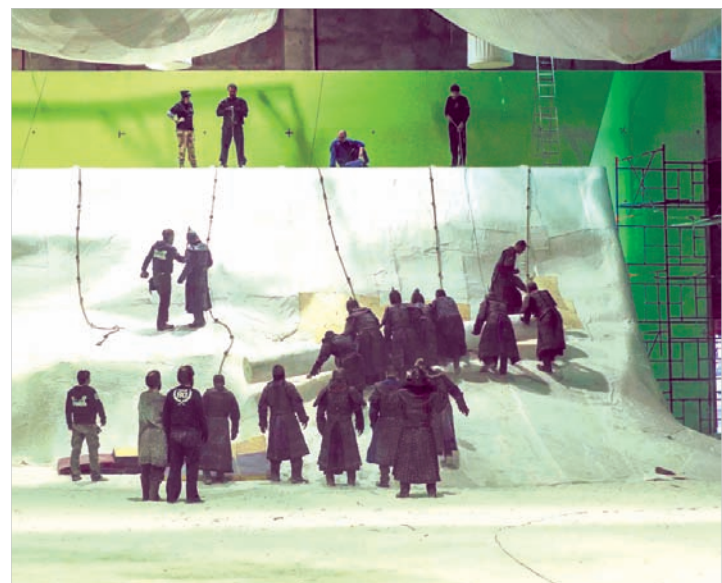
Съемки в павильонах с зелеными стенами дают простор фантазии актеров и мастеров компьютерной графики.

Материал предоставлен ООО «Столица» специально для «Вечернего Ставрополя».