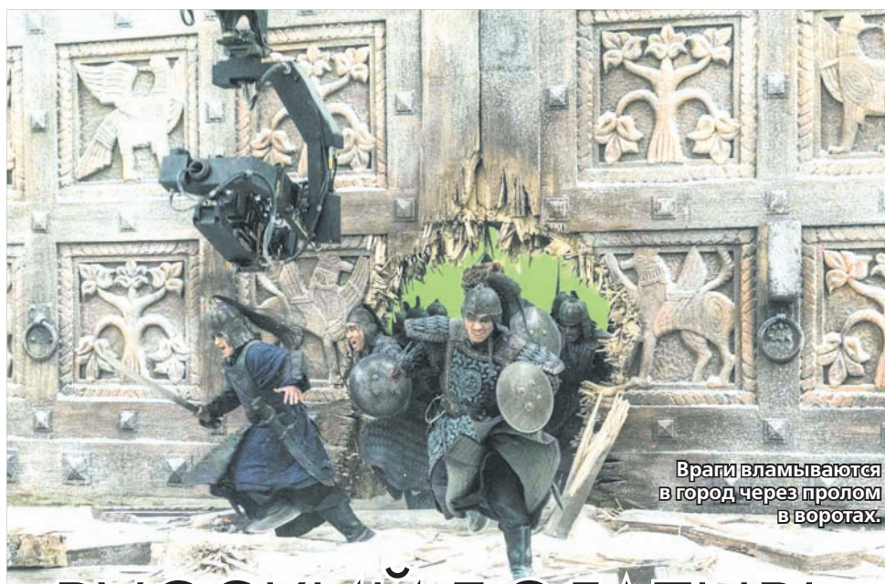
Враги вламываются в город через пролом в воротах.