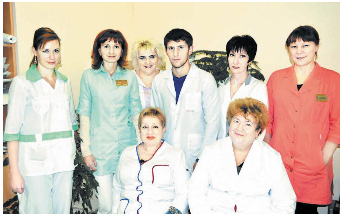
Коллектив отделения ревматологии (не весь!)

Итак: 6 марта 2011 года. Мужчины поздравляют женщин с праздником, все обмениваются подарками... А я с ужасом понимаю, что не могу взять в руки кружку с чаем: пальцы стали, как сосиски, никак не гнутся, слабость, а вроде как ничего и не болит. Девятого марта я была уже в шестой поликлинике и оттуда прямо поехала во вторую больницу. В ревматологию: диагноз по поводу отказавших почек (слава Богу!) не подтвердился.