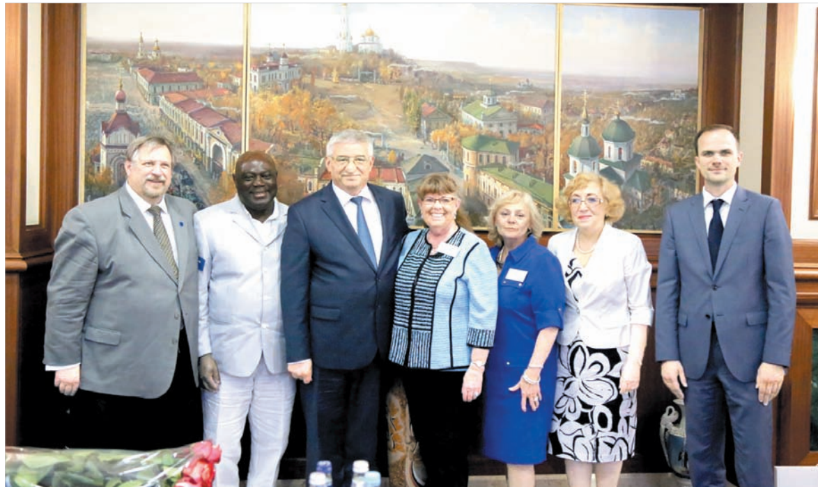
Фото на память о теплом приеме в администрации Ставрополя.

Но особенно интенсивно развивалось сотрудничество в сфере образования. Представители деловых кругов и коммерческих структур Ставрополя и Де-Мойна участвовали в совместных семинарах, в Де-Мойне была организована стажировка руководителей учреждений образования города Ставрополя. Они изучали структуру управления образованием, принципы и способы внутришкольного контроля, систему поиска, отбора и обучения талантливой молодежи. Официальные контакты по образовательной линии превратились со временем в конкретные программы. К примеру, наши ребята из центра «Поиск» ездили в Де-Мойн на обучение - в школы и частный университет Дрейка.