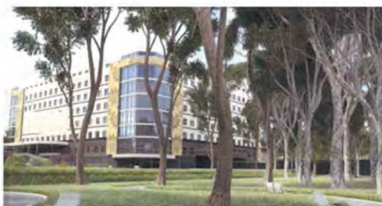
Завершается строительство клинического перинатального центра и поликлиники в Юго-Западном микрорайоне.