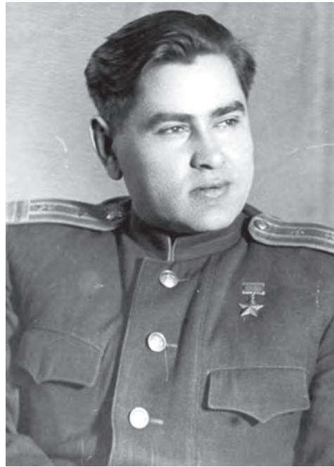
Майор А. П. Маресьев, 1945 год.

И вот в чём парадоксальность – как только ушла необходимость жить по принципу «Если не я, то кто?», то следы истинной человечности всё реже и реже оставляют отпечатки в жизни современного обще-