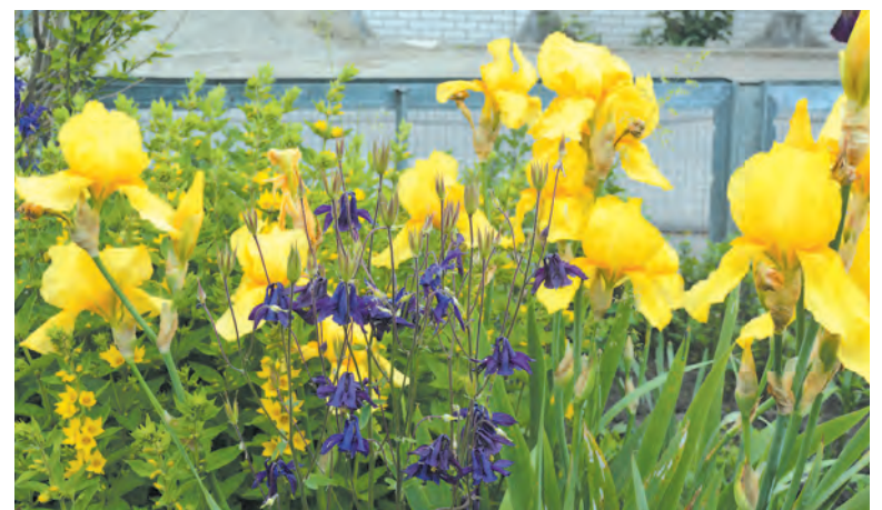
Желтые ирисы — старожилы палисадника.