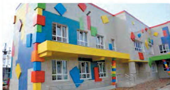
Построены 1 школа и 1 детский сад, приобретены 2 детских сада, завершается строительство школы.