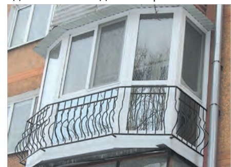
«Французский» балкон в современном исполнении.

Впервые в стандарте указываются типовые размеры и нагрузки к современным оконным конструкциям, а также требования к их установке. Документ, например, определил расчётные ветровые нагрузки на светопрозрачные конструкции, включая оконные и балконные блоки, а также остекление балконов и лоджий. Это поможет избежать продувания оконных конструкций в зависимости от месторасположения домов. Впервые в новом ГОСТе прописаны нормативы по остеклению жилых зданий высотой до 75 метров.