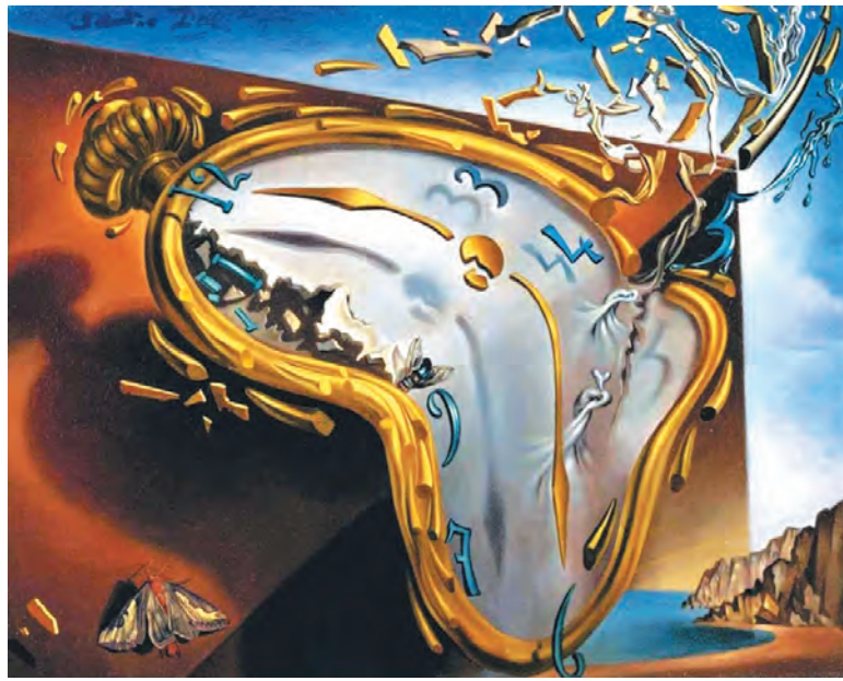
Сальвадор Дали. Утекающее время.

Многие из нас полагают главными положительными качествами человека его безудержную напористость и безукоризненную пунктуальность в достижении каких-либо результатов. Ну а результаты, как правило, не выходят за рамки материальных или карьерных устремлений. У нас, россияне, не очень, скажем так, расторопных в этих вопросах, примером для подражания являются немцы или японцы, для которых личный материальный достаток, как и могущество фирмы, – это самые главные целевые установки в жизни. Но вот статистика (неподкупная), которая говорит о том, что в Японии, как и в высокоразвитой Южной Корее, самое большое число самоубийц. И выставляемая причина та, что люди на своих рабочих местах превращаются в роботов. И потому для них даются эти психологические нагрузки, когда в разрывах они могут попинать и поиздеваться над манекенами и изображением вышестоящего начальства (начальников цехов, мастеров и т.д.), а в выходные дни даже поощряется возможность напиваться до беспамятства, чтобы тем самым снять накопив-