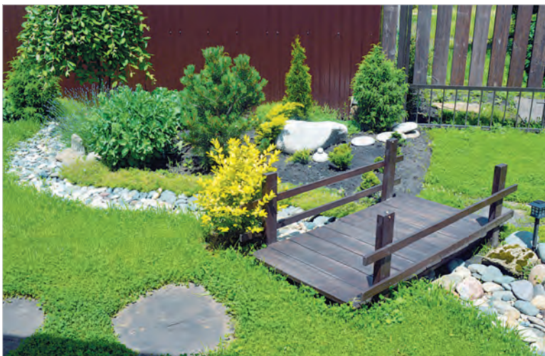
«Сухой» ручей и мостик, сделанный хозяином дома.