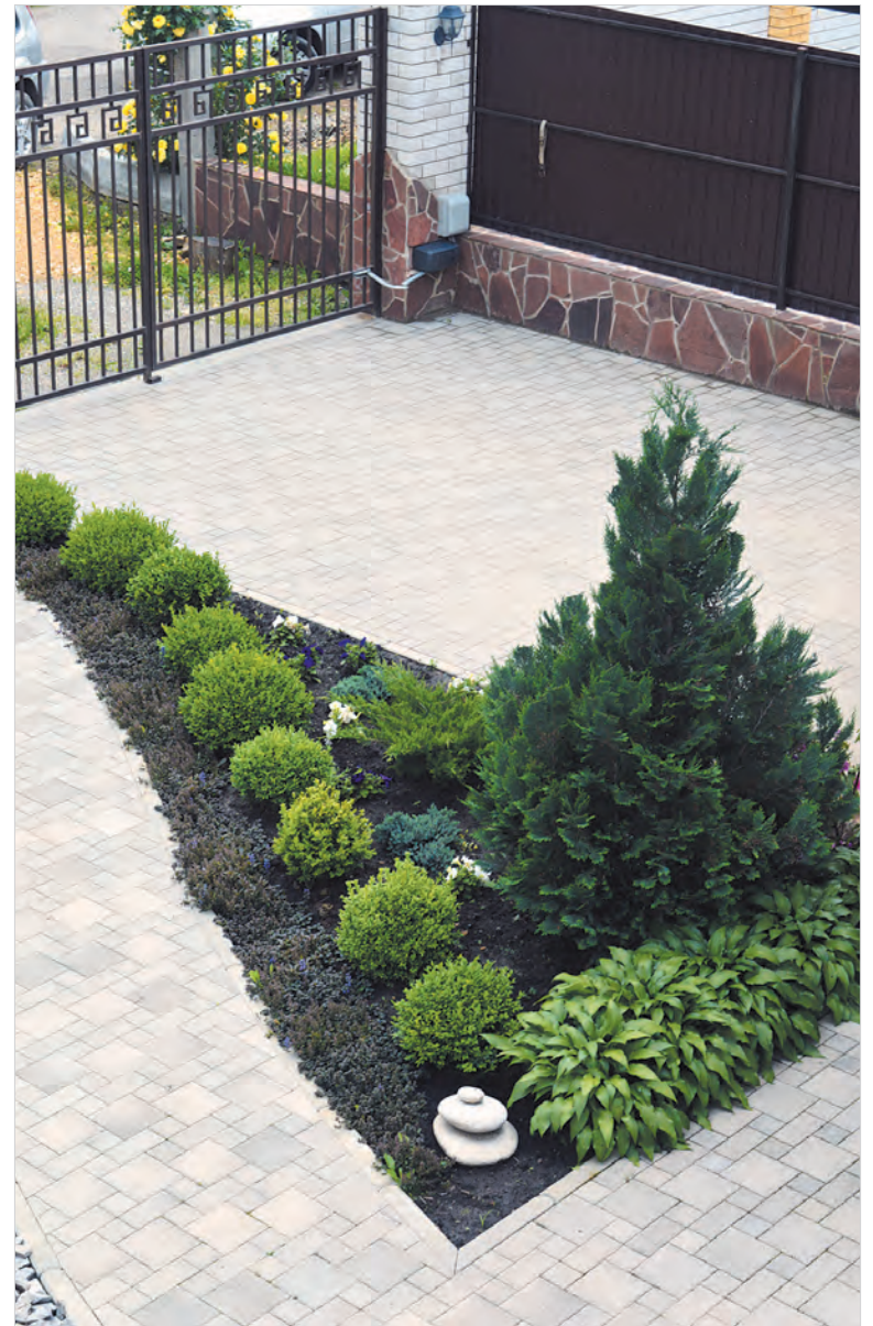
Растительный «островок» среди бетона.

Мы постарались запечатлеть на фото наиболее интересные фрагменты придомовой территории. Конечно, статичное фото не может передать красивую панораму, которая открывается проходим сквозь прозрачный забор. Но у наших читателей есть возможность ее увидеть. Заходите на сайт нашей газеты, смотрите видеоролик и получайте эстетическое наслаждение.