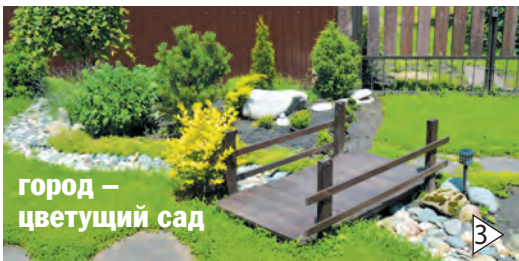
город – цветущий сад