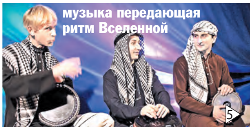
музыка передающая ритм Вселенной