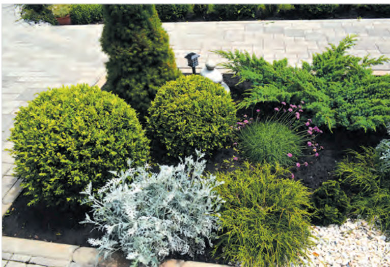
«Ассорти» из многолетних кустарников.