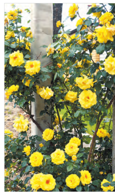
Любимые розы, декорируют электростолб перед забором.