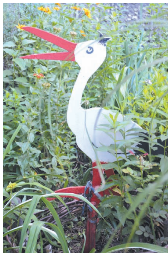
Аист, который никуда не улетит.

например, магония с кожистыми глянцевыми листьями темно-зеленого цвета и темно-синими ягодами, кстати, съедобными.