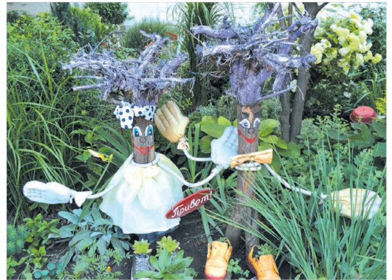
Садовые обитатели — с приветом ко всем прохожим!

надумала продавать дачу. Жалко было расстаться с любимыми растениями. Вот и забрала те, что смогла, переселив их под окна квартиры. Конечно, за эти годы здесь появились и другие — что-то купила, что-то размножила. И теперь здесь плотные посадки всевозможных растений. В палисаднике — несколько волн цветения, начиная с ранней весны и до поздней осени. Многолетники и однолетники, почвопокровные растения. Декоративный зверобой Мозера, клематисы, жимолость, древовидный пион, розы — кустовые и плетущиеся, гортензии. Вечнозеленый бересклет и пирамидальная туя, кусты вейгелы трех сортов, гибискусов, керии... Есть и такие кустарники, которые редко встречаются в других палисадниках, как,