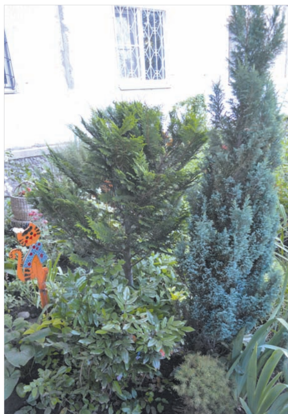
Пирамидальная туя — из черенка.