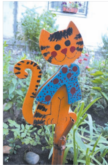
Рыжий кот Леопольд.

Обустройством участка за домом, как рассказала женщина, она занялась с 2005 года, когда