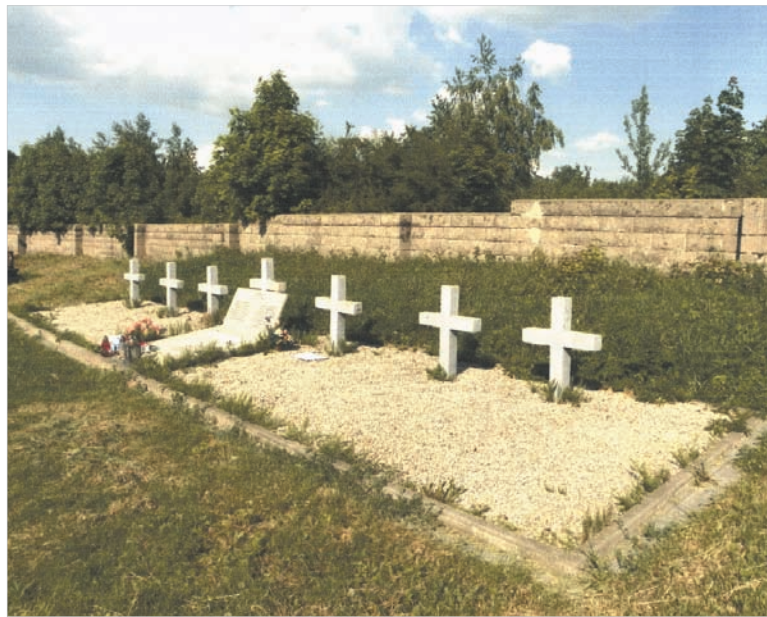
Братская могила в Польше: тут захоронен Александр.