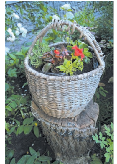
А на пенёчке в корзине выросли... цветы.