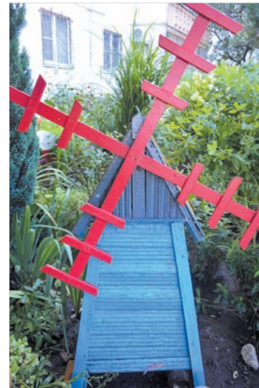
Атрибуты сказочной деревни.

надумала продавать дачу. Жалко было расстаться с любимыми растениями. Вот и забрала те, что смогла, переселив их под окна квартиры. Конечно, за эти годы здесь появились и другие — что-то купила, что-то размножила. И теперь здесь плотные посадки всевозможных растений. В палисаднике — несколько волн цветения, начиная с ранней весны и до поздней осени. Многолетники и однолетники, почвопокровные растения. Декоративный зверобой Мозера, клематисы, жимолость, древовидный пион, розы — кустовые и плетущиеся, гортензии. Вечнозеленый бересклет и пирамидальная туя, кусты вейгелы трех сортов, гибискусов, керии... Есть и такие кустарники, которые редко встречаются в других палисадниках, как,