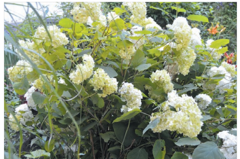
Благодарная на цветение гортензия.

ловны и лоджия — самая яркая во всем доме. Казалось бы: несколько ящиков с петуньями, декоративные решетки по краям для вьющихся растений. Но как преобразился фасад первого этажа! К сожалению, цветущая лоджия — единственная во всем доме с десятками квартир. А ведь если хотя бы один-два ящика с цветами на каждом балконе — и панельный невзрачный дом стал бы украшением квартала, а для кого-то — источником вдохновения и радости.