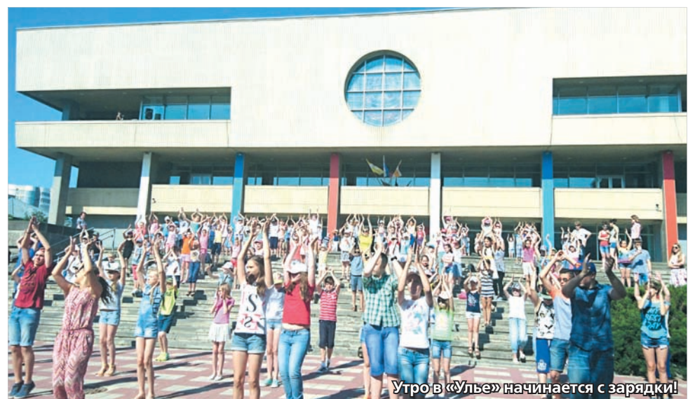
Утро в «Улье» начинается с зарядки!