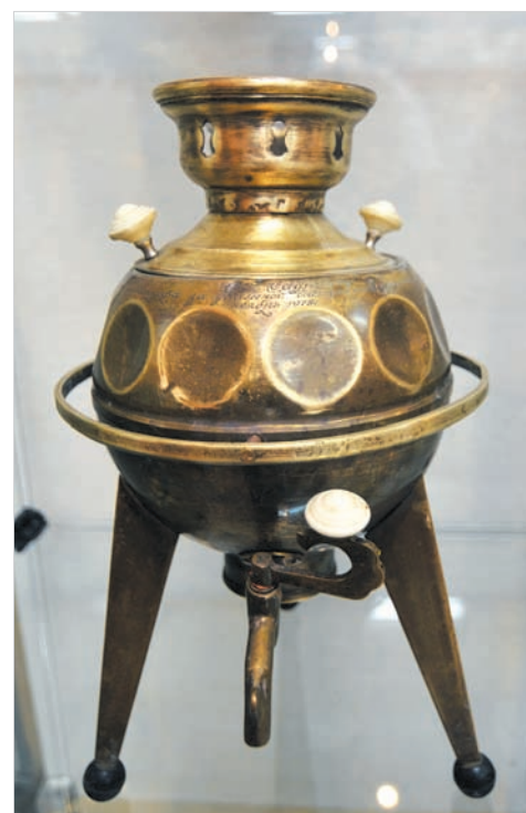
Запуск спутника отразился на дизайне советского самовара.