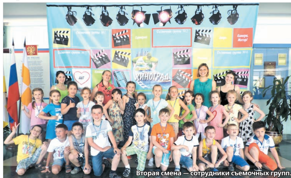
Вторая смена — сотрудники съемочных групп.

Зарисовки из лагеря «Веселый улей»: авторы - дети