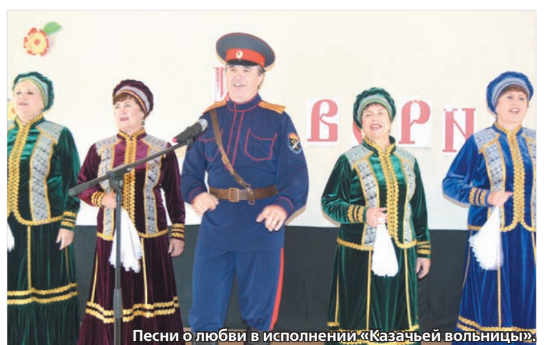
Песни о любви в исполнении «Казачья вольница».