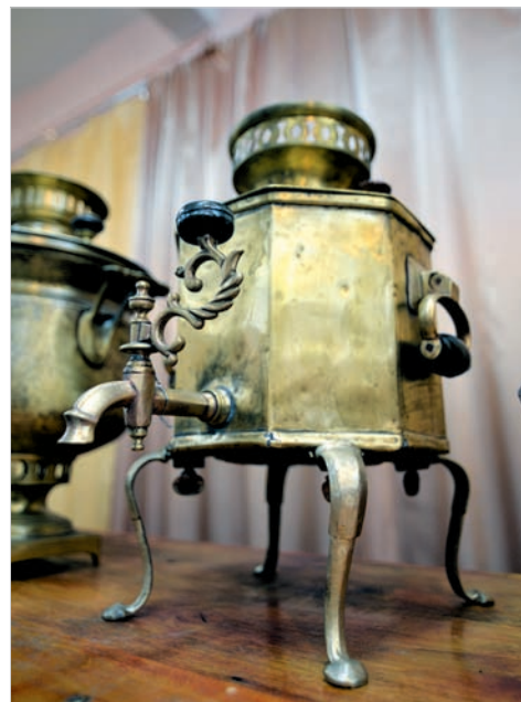
Походный самовар (XIX век).