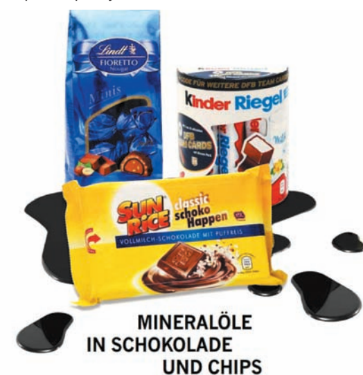
MINERALÖLE IN SCHOKOLADE UND CHIPS

К сведению: минеральные масла MOAH (Mineral Oil Aromatic Hydrocarbons) и MOSH (Mineral Oil Saturated Hydrocarbons), попадая в организм с продуктами питания или через косметические средства, могут накапливаться в жировых клетках, лимфатических узлах, селезенке и печени. Исследования на животных показали, что упомянутые вещества приводят к повреждению жизненно важных органов и провоцируют возникновение опухолей. Согласно данным Европейской организации по безопасности продовольствия (EFSA), наиболее подвержены риску дети.