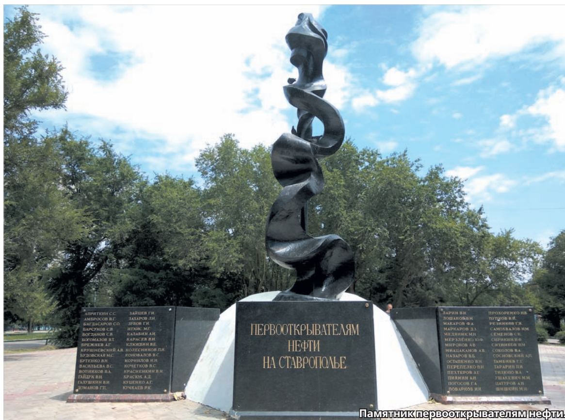
Памятник первооткрывателям нефти.