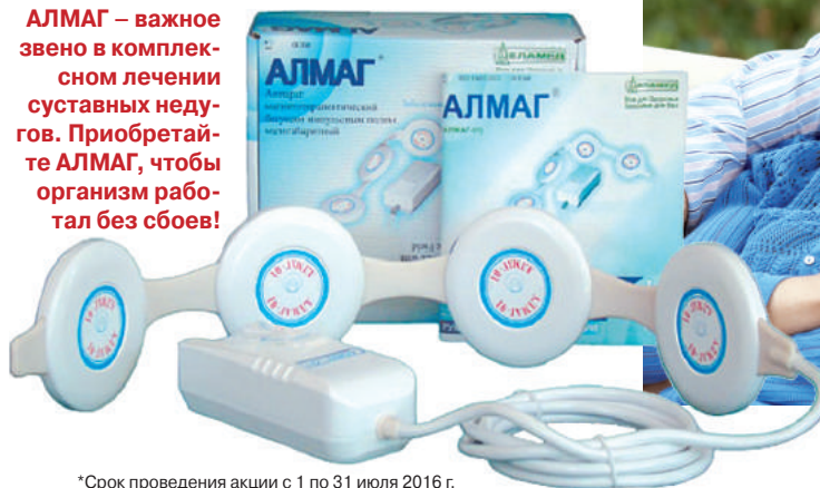
*Срок проведения акции с 1 по 31 июля 2016 г.

АЛМАГ – важное звено в комплексном лечении суставных недугов. Приобретайте АЛМАГ, чтобы организм работал без сбоев!