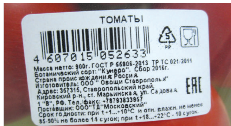
«Чужим» томатам «приписали» ставропольское происхождение.

Мы связались с Российским институтом потребительских испытаний. По нашей просьбе специалисты предоставили нам фото исследуемых образцов томатов, а также декларацию соответствия на овощи, которую предоставил экспертам магазин. Ставропольский производитель, познакомившись с этим документом, ответил: отношения к нему никакого не имеет. Декларация соответствия, представленная магазином МЭТРО, была выдана агрохолдингу «Мос-