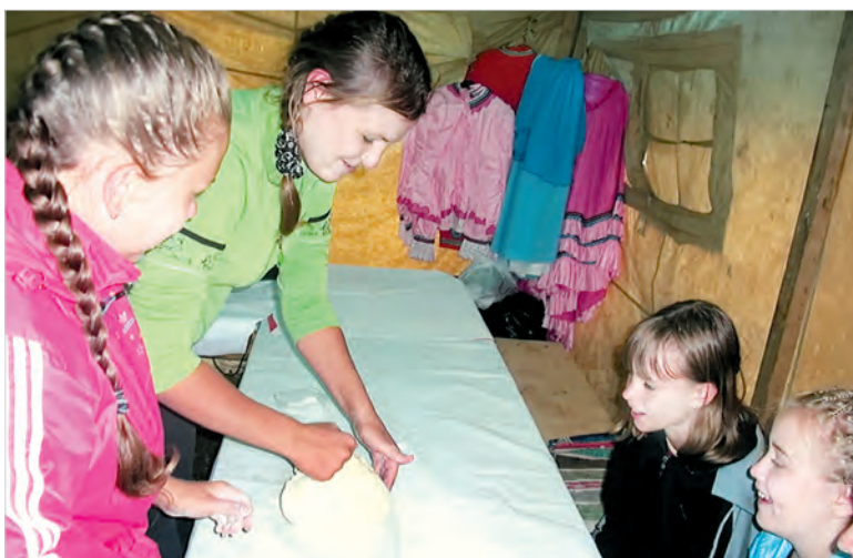
Девчата месят тесто для пирогов, которые будут печь на углях от костра.

Кстати, ведь и власти КЧР поначалу стали помогать. Даже сейчас, когда из правительства республики пришел запрет на организацию детского отдыха, из некоторых министерств того же правительства отцу Александру поступают звонки с уточнениями, какая помощь необходима. Справедливости ради сто-