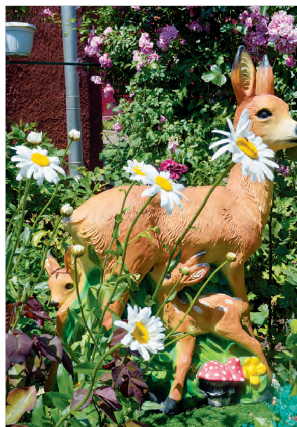
Олениха с детенышами в цветочном раю.

Вообще, наскоком осмотреть цветущее хозяйство домовладения не получится. Здесь нужно разглядывать все не спеша, подробно. Это можно сделать даже не заходя во двор. Цветник хорошо просматривается через решетчатый забор. Вот взгляд притянуло к себе большие садовые скульптуры – девочки и мальчика с корзинами цветов. Рядом спряталась в цветах олениха с детенышами, а дальше – ежата под грибом, гномы... А вот – маленькая озорная наездница на белогривом коне в окружении желтой энотеры.