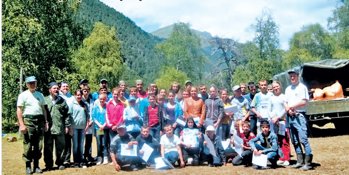
Фото на память. Они расставались со слезами. И весь год мечтали вернуться в Маруху, чтобы встретить старых друзей и обрести новых.