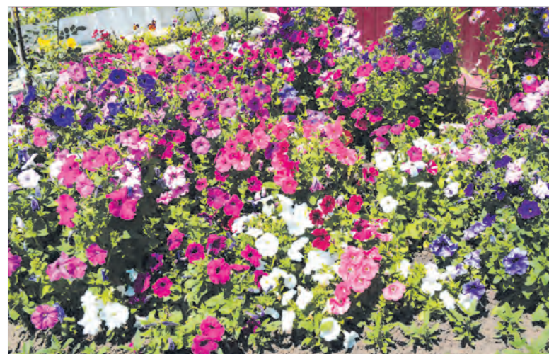
Ковер из петуний.