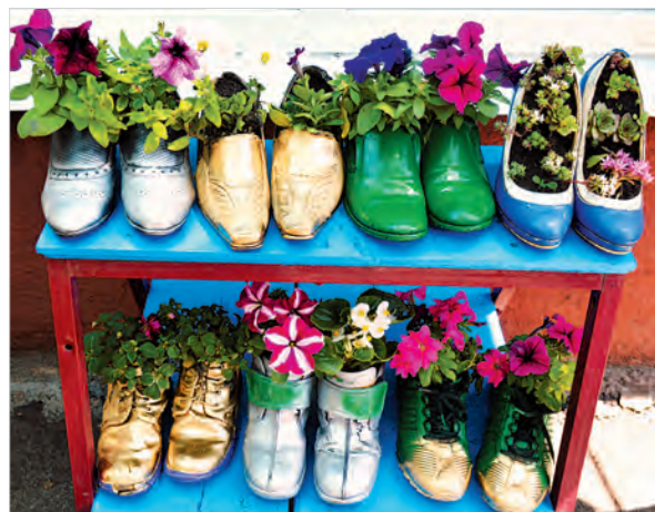
Для садового декора и обувь сгодилась.