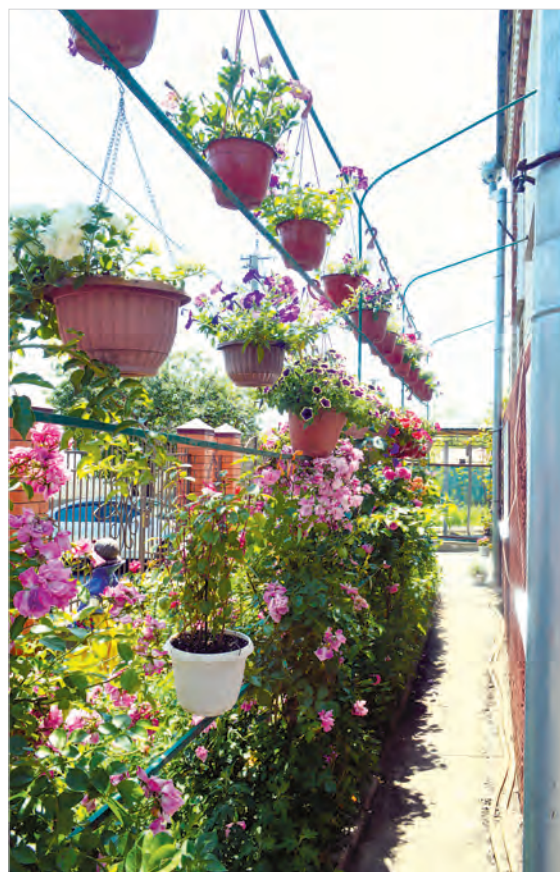
Петунии – в три яруса.

ков, увы, остатки. Не все выстояли под градом. Некоторые погибшие растения пришлось заменить яркой бегонией.