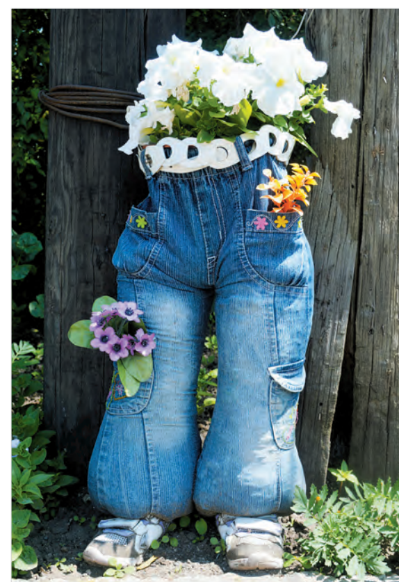
У вазы – джинсовый «прикид».

Но садовый декор – лишь дополнение к цветочному многообразию палисадника. Даже ориентировочно нельзя назвать, сколько в нем растений. Они и стелются ковром, и стоят стеной. Только петунии в ампельных горшках перед домом вывешены в три яруса. Их около трех десят-