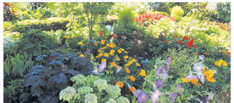
После прошедших дождей в палисаднике буйство зелени и красок.