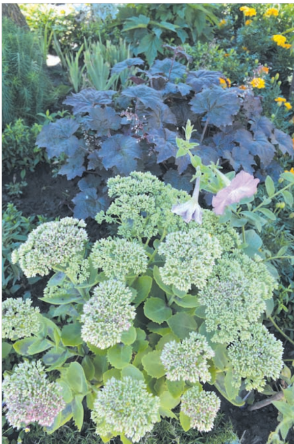
Гейхера и очитки — любимые многолетники.

Ведущая проекта журналист Лариса ДЕНЕЖНАЯ.