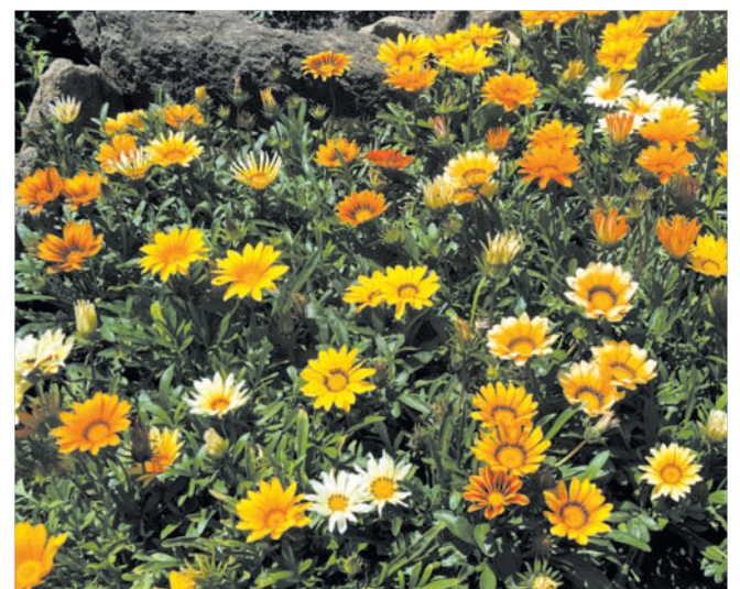
Гаяцния — желтый остров.