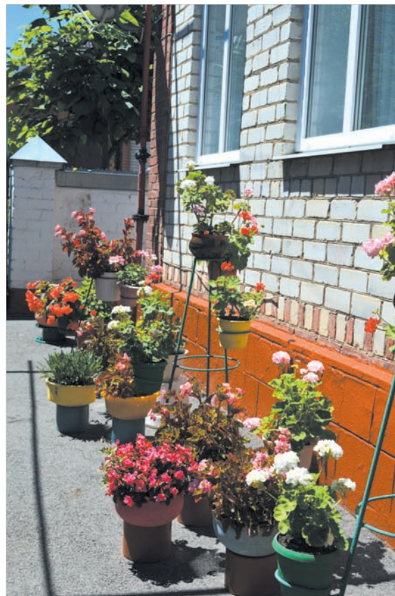
Цветы на «летней» квартире.