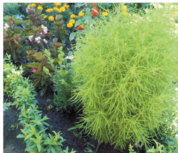
Пушистый «шарик» кохии.