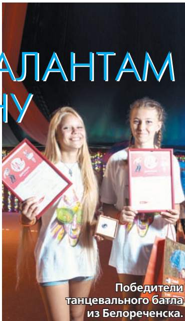
Победители танцевального батла из Белореченска.

здесь ничего, кроме интернета и желания проявить себя, не требуется. За комментарии, голосования, «лайки», «репосты» в соцсетях посетители сайта получают специальные баллы. В конце года МТС переводит эти баллы в реальные деньги, которые направляет на лечение детей. С 2014 года организаторы проекта собрали более 14 миллионов рублей, что помогло вылечить и провести операции 21 ребенку из самых разных точек нашей необъятной страны.