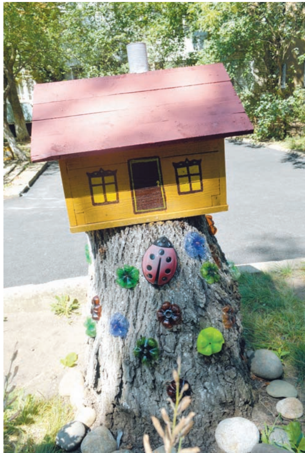
Дом, как декорация для пня.