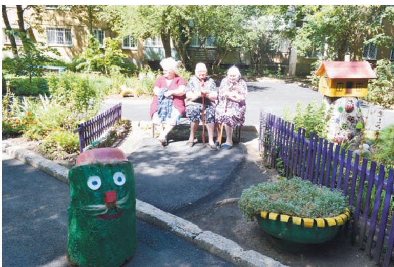
В таком дворе приятно отдохнуть.

Редкие цветы могут расти без солнца. А если практически весь двор дома в тени и освещены лишь небольшие островки? Но хочется не только буйной зелени, но и ярких красок. Жители дома 39 по ул. Доваторцев нашли выход. И недостаток цветения компенсировали декором.