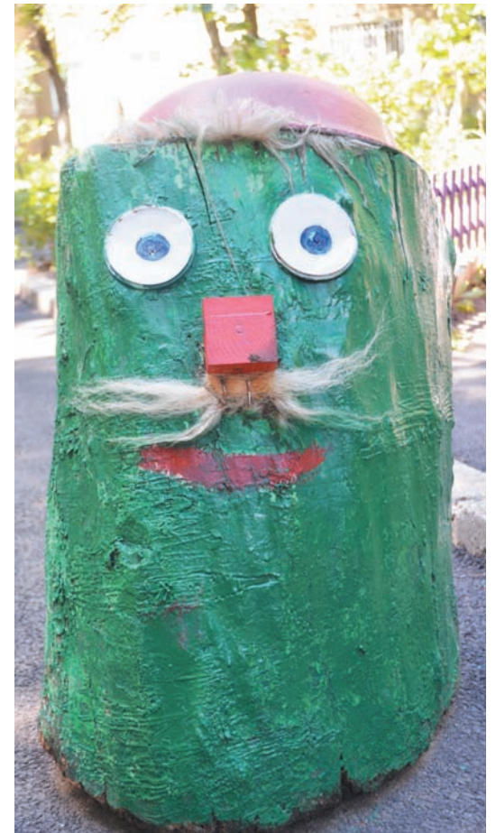
Усатый нянь... из дерева.