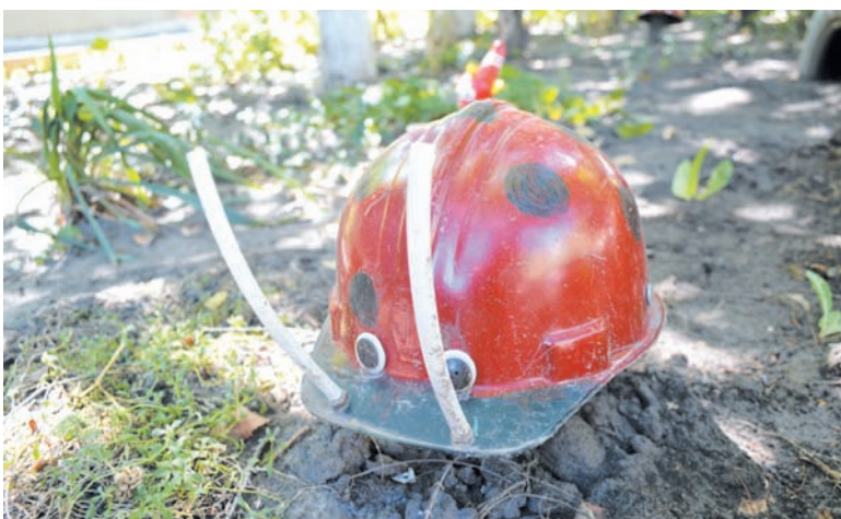
Жук-«рогач» из каски.