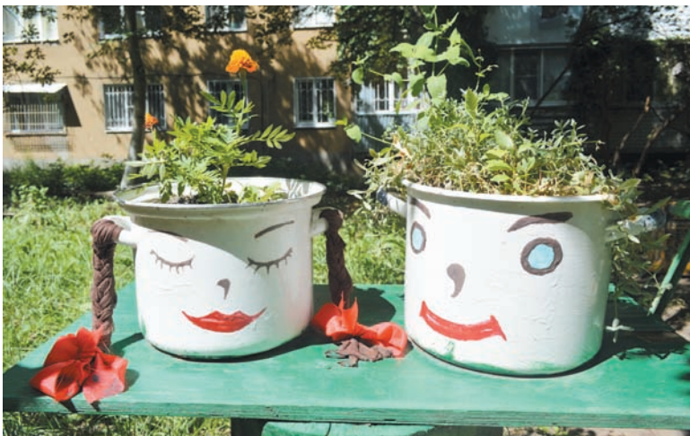
Позитивные кастрюльки – емкости для цветов.

На самом солнечном месте разместились цветы в старых