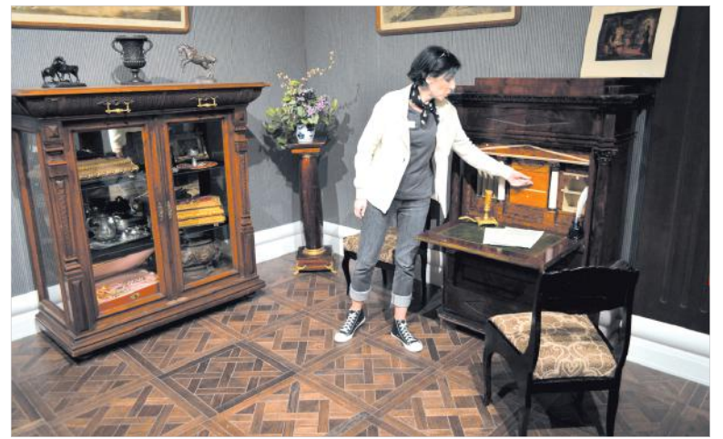
В кино играет даже мебель (секретер из фильма о Шерлоке Холмсе).

Зрители разных поколений знают и любят фильмы, созданные в разные годы на киностудии «Ленфильм». Здесь снимались: «Гамлет», «Король Лир», «Свадьба в Малиновке», «Всадник без головы», «Шерлок Холмс и доктор Ватсон», «Собачье сердце», «Собака на сене», «Труффальдино из