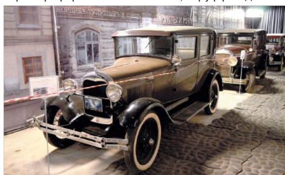
В ленфильмовском «Гараже».