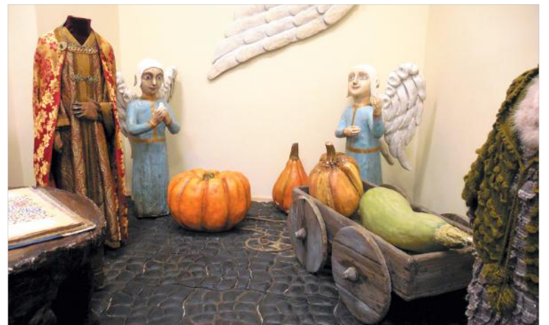
Фрагмент декорации и реквизит из новой сказки «Самый рыжий лис».