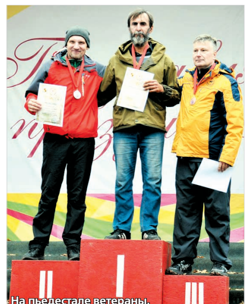
На пьедестале ветераны.

нова, – это вид спорта, в котором органически сочетается физическая и умственная нагрузка, что делает его в своем роде уникальным.