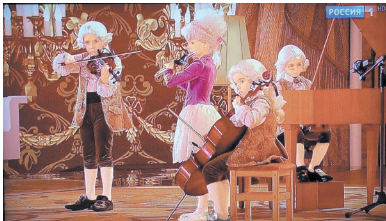
Третий сезон конкурса «Синяя птица»: играет квартет «Рококо».