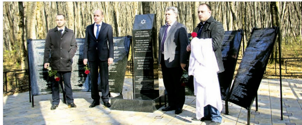
На открытии обновленного мемориала в ставропольском Русском лесу.