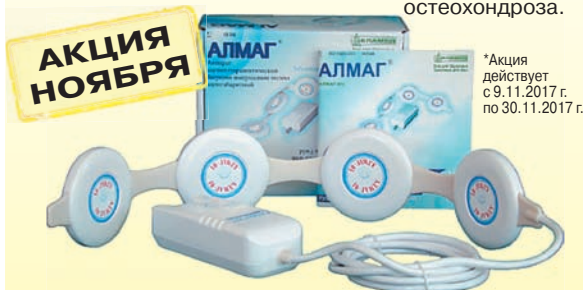
АЛМАГ-01 Работает. Проверено!

Компания ЕЛАМЕД открыта для своих клиентов, потому что ценит их и работает на совесть.