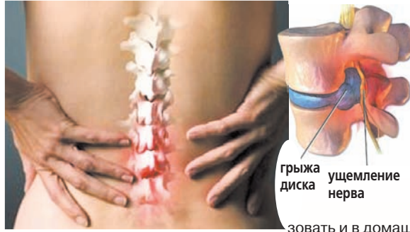
грыжа диска ущемление нерва

Если у человека с хронической болью в спине развивается депрессия, то формируется порочный круг. В мозге уменьшается выработка гормона серотонина, который обладает обезболивающим действием. Восприятие боли усиливается. Чтобы не допустить такого состояния, нужно вовремя начать лечение остеохондроза.