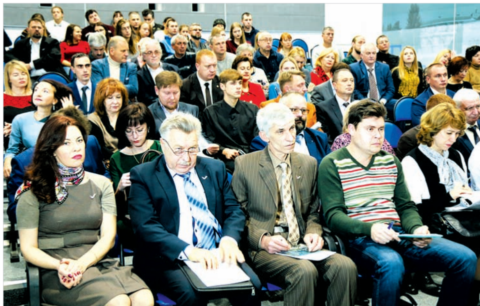
Публичные слушания по поводу «зеленого щита» вызвали самый живой интерес у ставропольцев.

В Ставрополе в здании недавно открывшегося музейно-выставочного комплекса «Моя страна. Моя история» состоялись публичные слушания по поводу создания «зеленого щита» вокруг краевого центра и других городов края, организованные Общественной палатой Ставрополя.