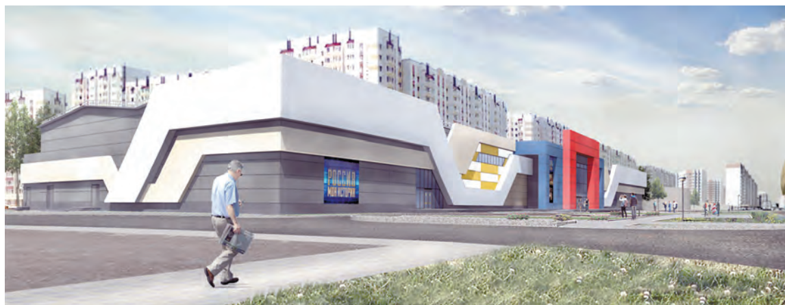
Так будет выглядеть музей «Россия – моя история».