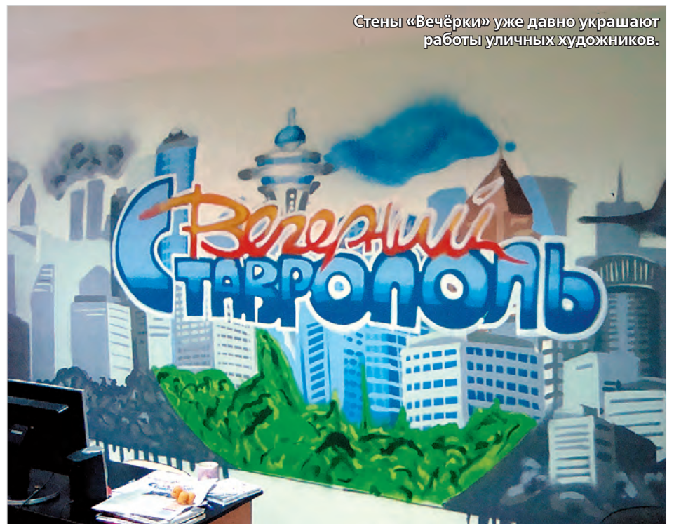
Стены «Вечёрки» уже давно украшают работы уличных художников.