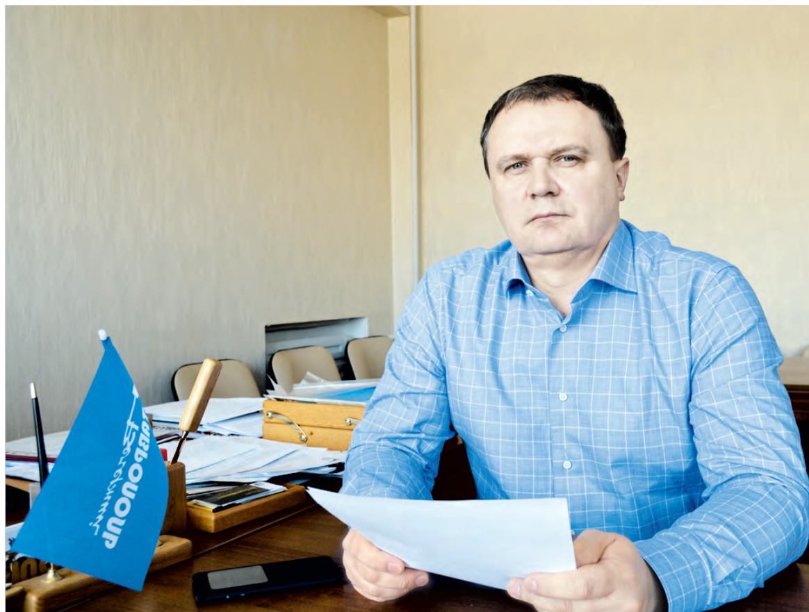
Главный онколог края Виталий Шутов.

– Интернет заполнен рекламой различных средств по удалению папиллом и бородавок. Их выпускают сейчас разные производители. Препараты продаются и в аптеках, и в секциях магазинов с различной оздоровительной продукцией. Я попробовала такое средство. В его составе кроме химического компонента еще и чистотел. Меня как раз подкупило то, что в его составе растительное сырье. При обработке этим средством было чувство жжения. Папилломы исчезли не сразу, только после нескольких не очень приятных процедур. На их месте остались пока красные пятна. Как вы относитесь к таким средствам? С одной стороны, раз их продают, значит, они прошли какую-то проверку, получили регистрацию. А с другой – агрессивная реклама таких средств настораживает. Не опасно ли их использовать?