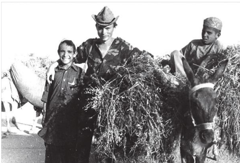
«Бачата» все время вились возле советских солдат, которые были немногим старше их.