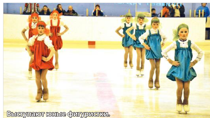
Выступают юные фигуристки.