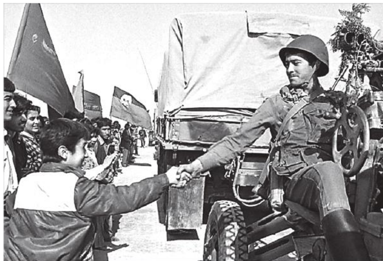
Среди местных было немало тех, кто встречал шурави, как защитников.