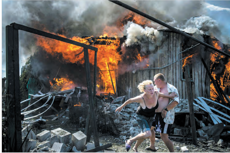
Одна из фотографий серии «Черные дни Украины» Валерия Мельникова, опубликована на сайте World Press Photo.

Фотожурналистский «Оскар» и пропуск на четыре выставочные площадки пару дней назад получил Валерий Мельников. Уроженец Невинномысского, выпускник Ставропольского государственного университета (ныне – СКФУ), он начал свою карьеру в газете «Ставропольские губернские ведомости» и