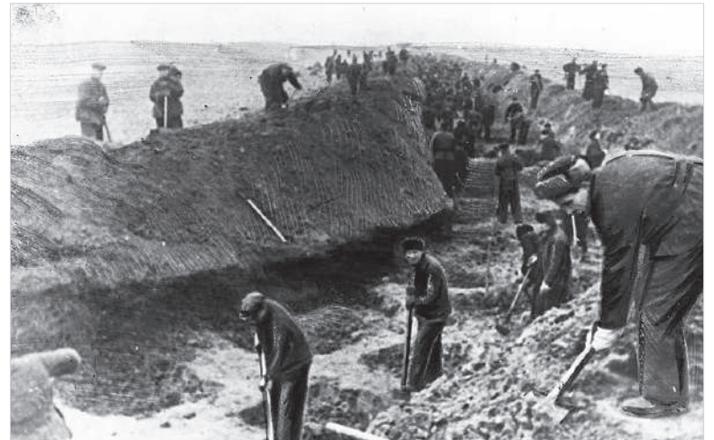
Жители города Ворошиловска (Ставрополя) на строительстве противотанкового оборонительного рва. Декабрь, 1941 год.

силах дал возможность фашистам стремительно продвинуться от Дона до Главного Кавказского хребта.