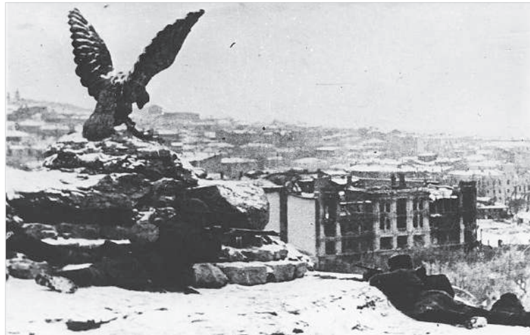
Советские автоматчики ведут бой за город Пятигорск. Январь, 1943 год.