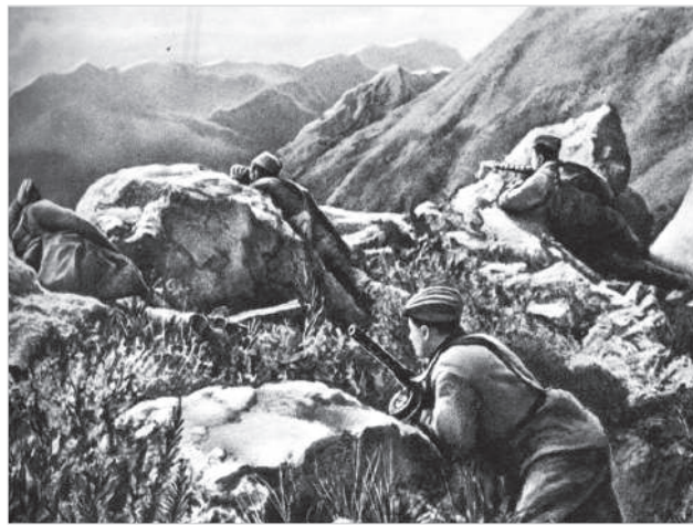
Автоматчики удерживают горный перевал. 1942 год.