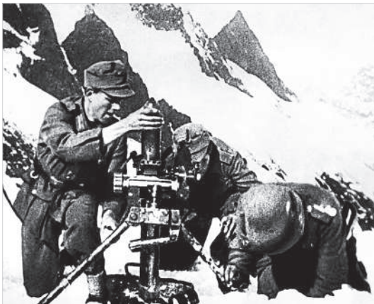
Немецкие минометчики ведут бой в горах Северного Кавказа (кадр из трофейной немецкой кинохроники «Солдаты «Эдельвейса»). 1942 год.