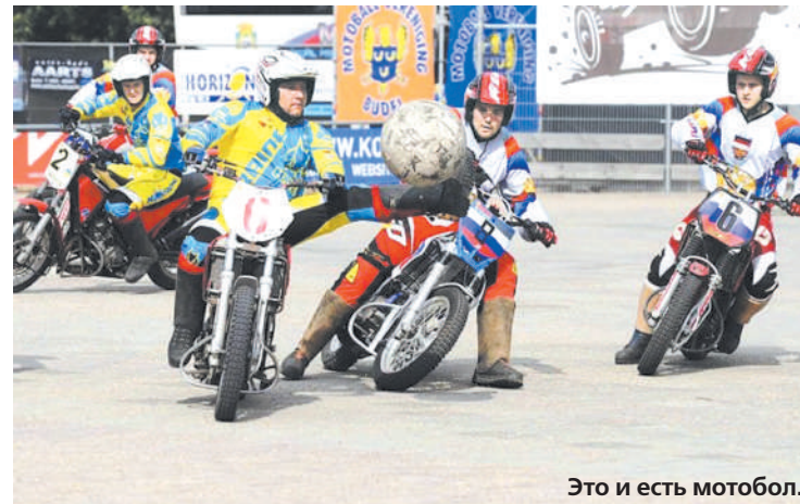
Это и есть мотобол.