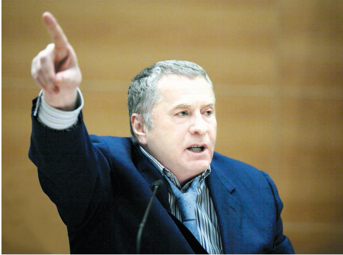
Владимир Жириновский: «Демография и образование – две ключевые проблемы страны».

Кроме того, следует обратить внимание на ситуацию, когда женщина, родившая двух детей, получает право на выплату материнского капитала, даже если дети рождены от разных отцов. При этом мужчина, у которого второй ребенок родился в новой семье, ничего не получает. Лидер ЛДПР отмечает: «Когда