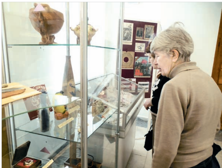
Экспонаты новой выставки вызывают неизменный интерес посетителей.