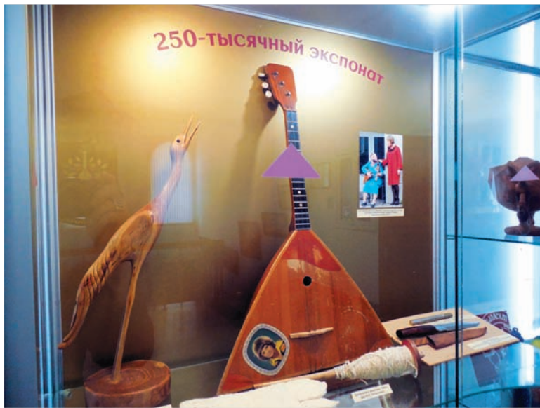
250-тысячный экспонат музея-заповедника в экспозиции выставки.

За свою историю музей-заповедник принимал на хранение предметы и документы самого