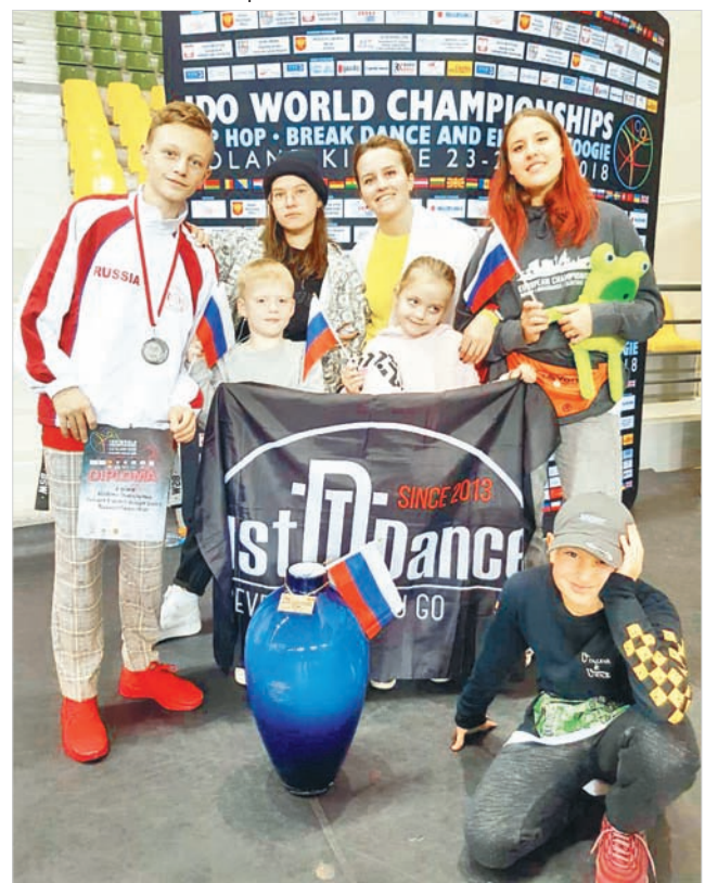
Ставропольские танцоры на чемпионате мира.

Сборная России, в составе которой выступали и воспитанники студии современного танца «Джаст дэнс» Ставропольского Дворца культуры и спорта, стала лучшей в командном зачете. Второе место у англичан, а на третье вышли хозяева танцпола – поляки.