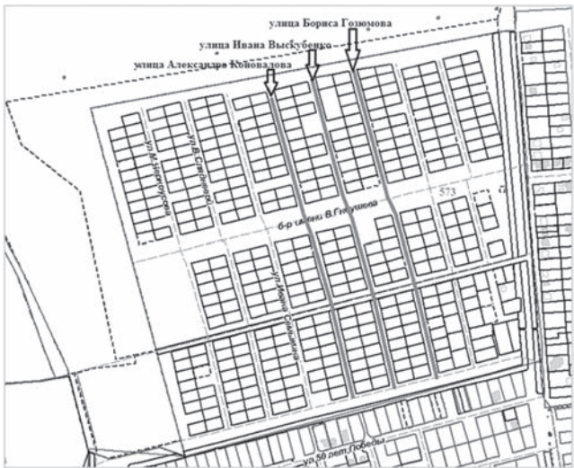
СХЕМА расположения улиц в 573 квартале города Ставрополя восточнее улицы Ивана Семькина