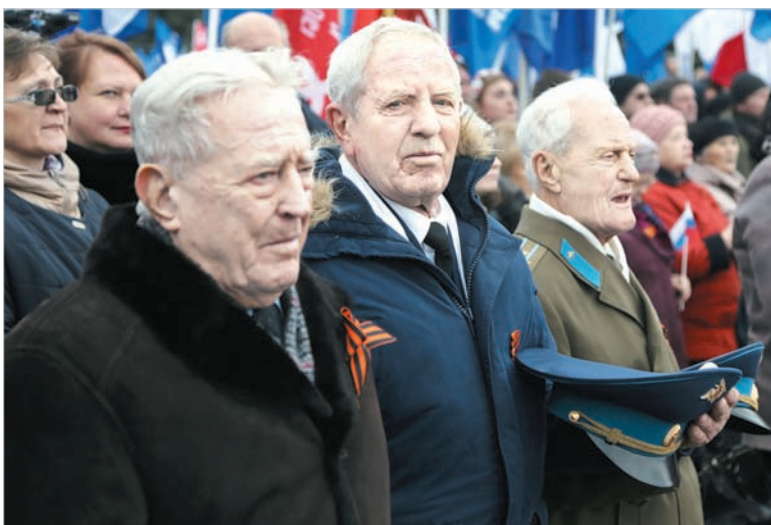
Ветераны были почетными гостями митинга-концерта.

ливший победный май 1945-го, был завоеван очень высокой ценой.