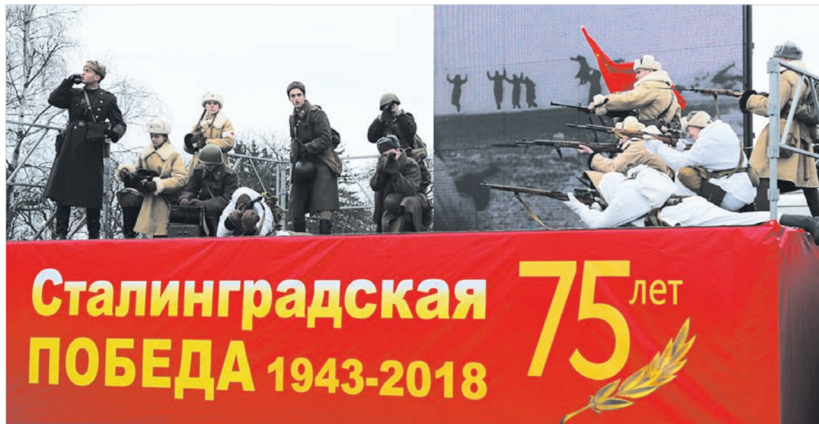
На сцене – историческая реконструкция.

Здесь были люди разных возрастов и профессий. И практически с самого начала между людьми словно исчезли разделительные линии помоста сцены, рядов для почетных гостей и площадью. Не существовало деления на выступающих и слушающих, на актеров и зрителей. И те, кто выходил к микрофону, и те, к кому они обращались, – все были участниками, все были в одной орбите с мощным центром притяжения памяти, благодарности, гордости и горечи. Потому что этот перелом в Великой Отечественной, наступивший у волжских берегов в феврале 1943-го и предопреде-