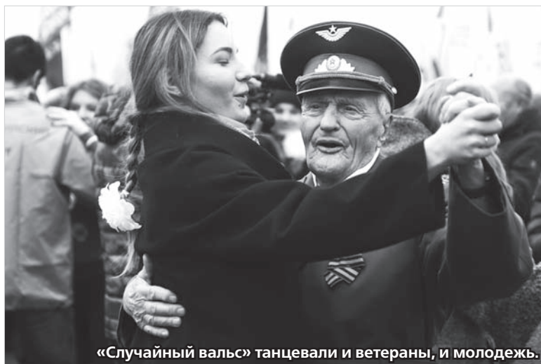
«Случайный вальс» танцевали и ветераны, и молодежь.