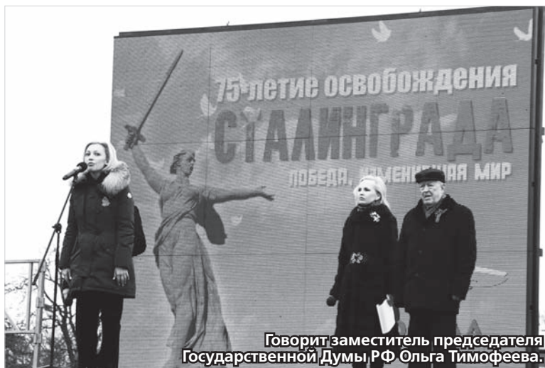
Говорит заместитель председателя Государственной Думы РФ Ольга Тимофеева.