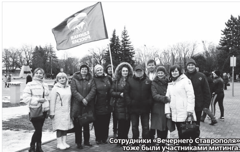
Сотрудники «Вечернего Ставрополя» тоже были участниками митинга.