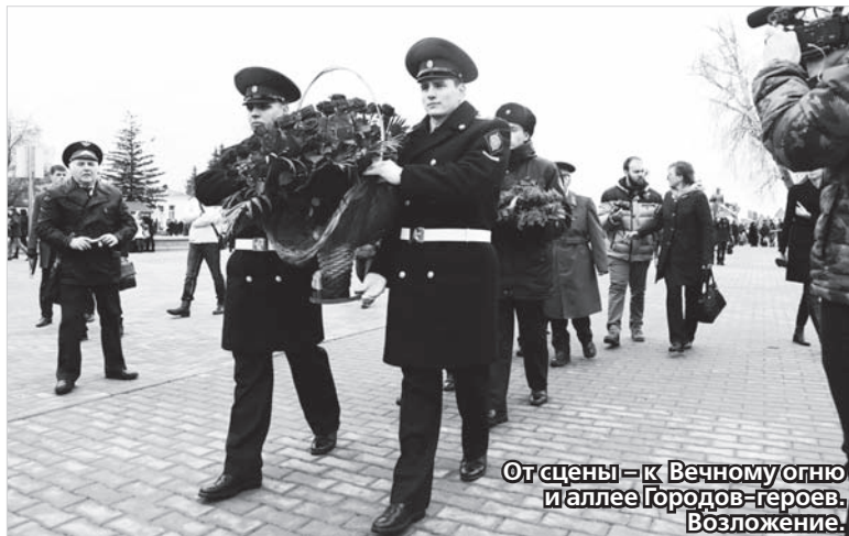
От сцены – к Вечному огню и аллее Героев-героев. Возложение.