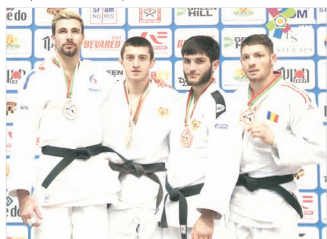
Пьедестал почета софийского турнира.