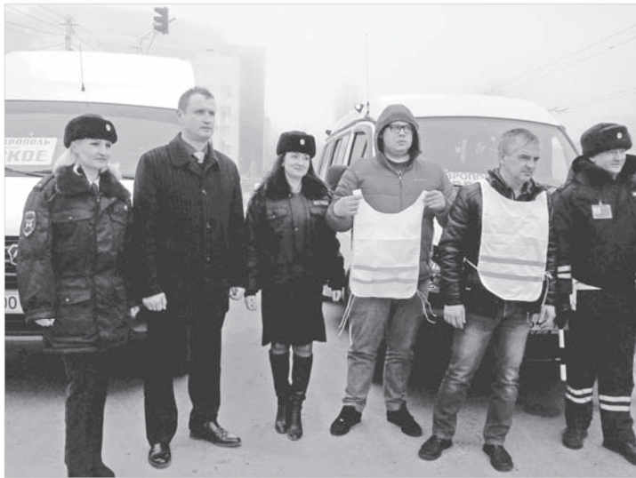
Светоотражающие жилеты пригодятся особенно в дальних поездках.

Руководитель рабочей группы по безопасности дорожного