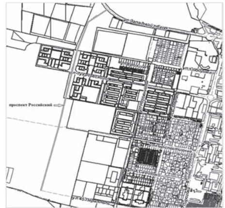
СХЕМА проспекта Российского города Ставрополя