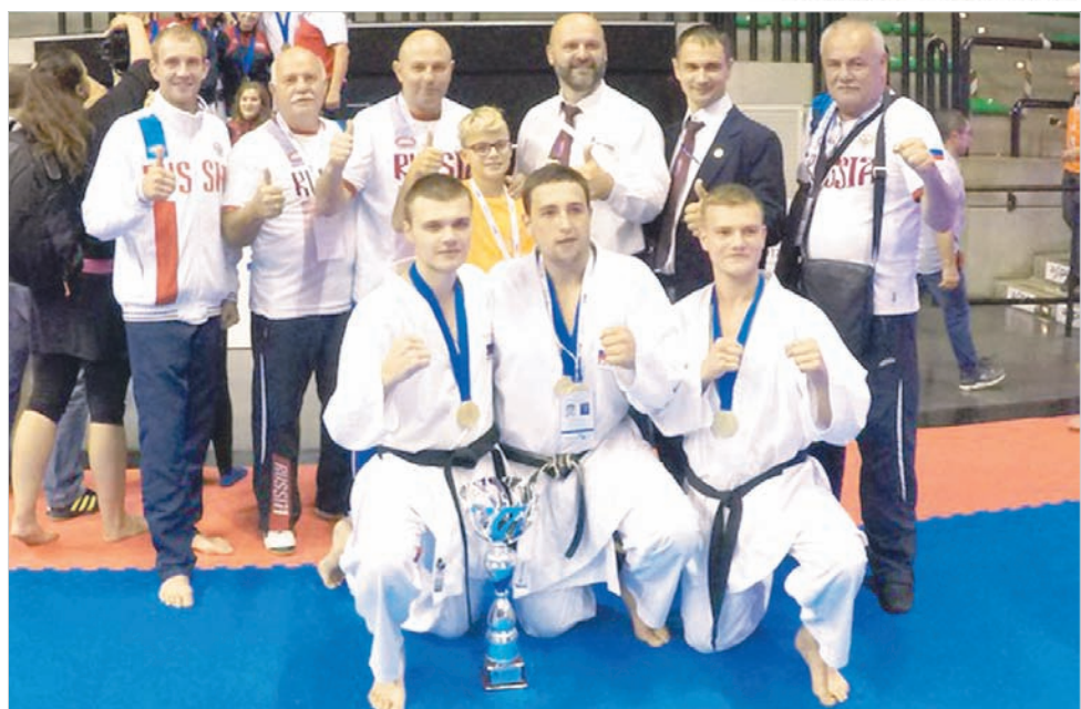
Бойцы «Газпром трансгаз Ставрополь – Сётокан» в составе сборной России.