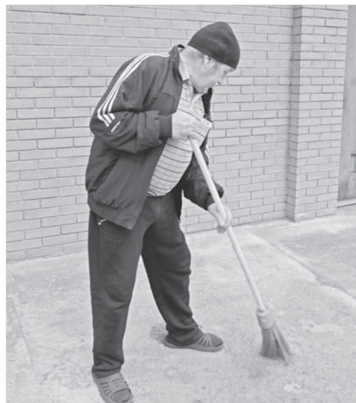
У каждого в центре — свои обязанности.