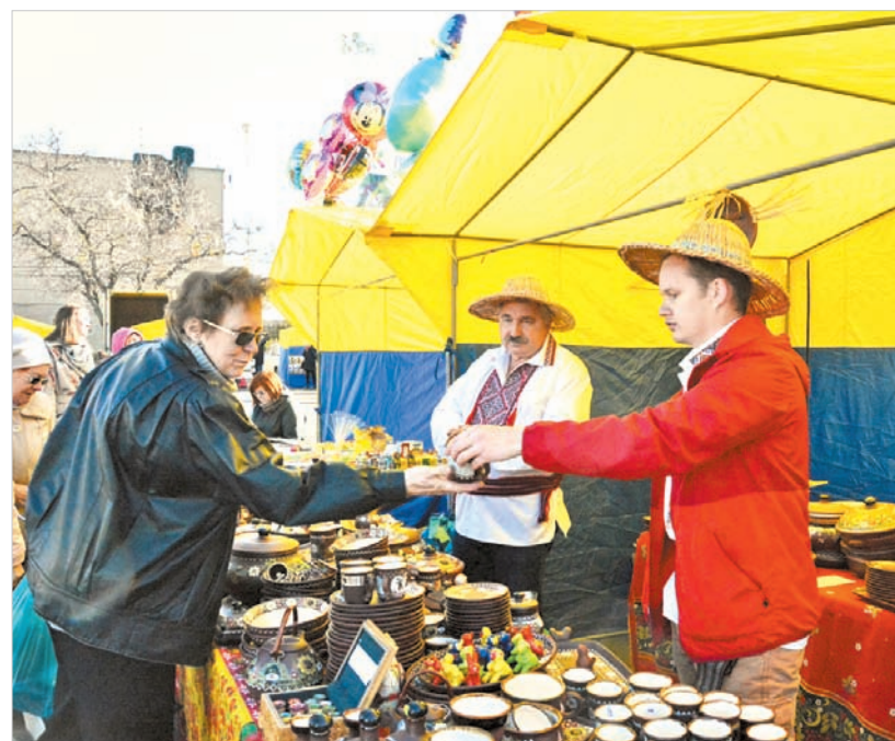
ГРАФИК ПРОВЕДЕНИЯ ЯРМАРОК ВЫХОДНОГО ДНЯ В МАРТЕ

В марте этого года запланированы пять ярмарок. Городские и краевые товаропроизводители порадуют горожан своей свежей продукцией.