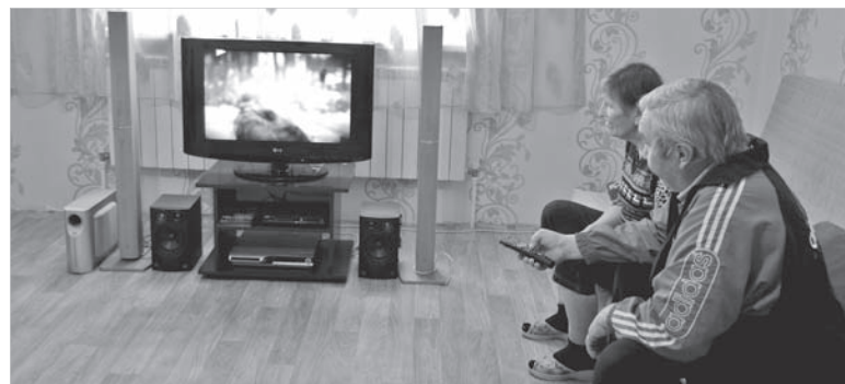
В свободное время можно посмотреть фильм.