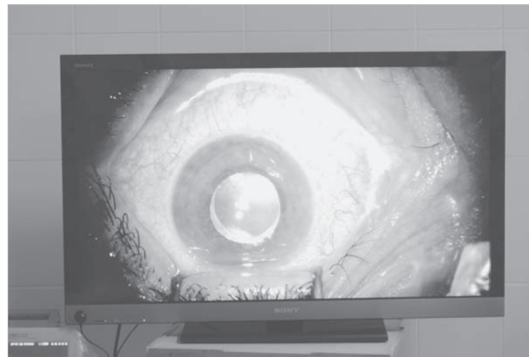
За ходом операции врачи следят по монитору.