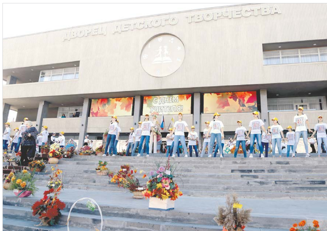
Так встречали любимых учителей на торжественном собрании, посвященном профессиональному празднику, 2 октября на ступенях СДДТ.