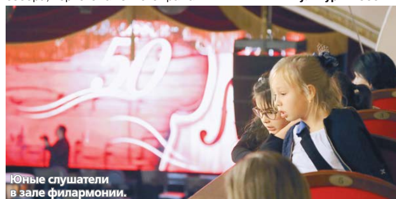
Юные слушатели в зале филармонии.