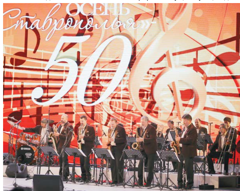
В фестивале принял участие старейший в мире непрерывно существующий джазовый коллектив.

Ольга МЕТЕЛКИНА.