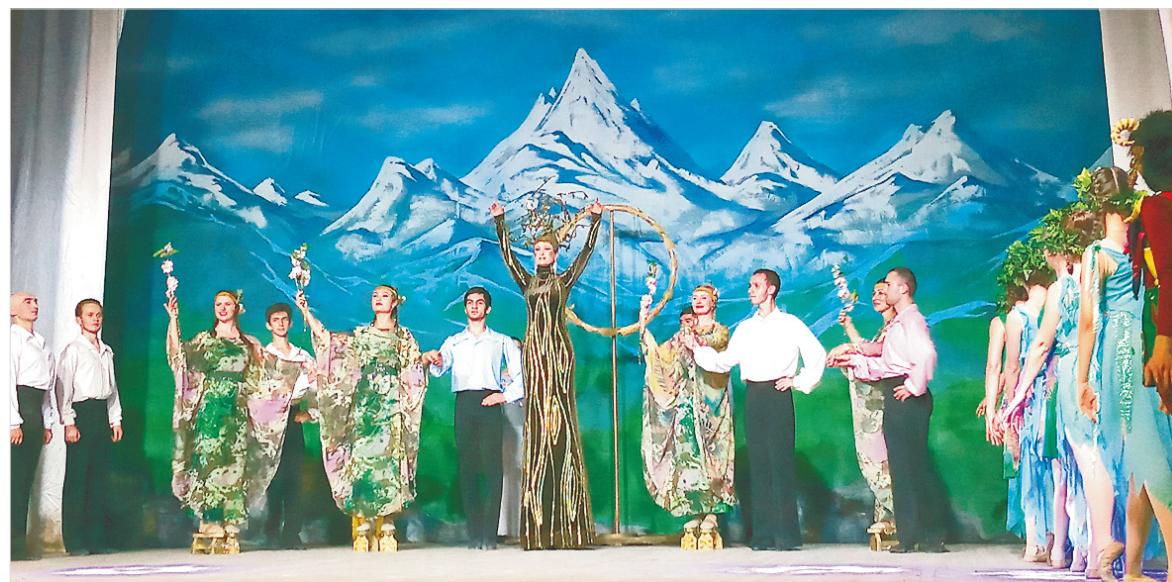
Сцены из спектакля Государственного музыкального театра Кабардино-Балкарской Республики «Гимн восходящему солнцу».

современным балетом на музыку Аслана Готова «Гимн восходящему солнцу» (хореография и постановка заслуженного деятеля искусств КБР Рамеда Пачева). Спектакль был создан при поддержке Министерства культуры РФ.