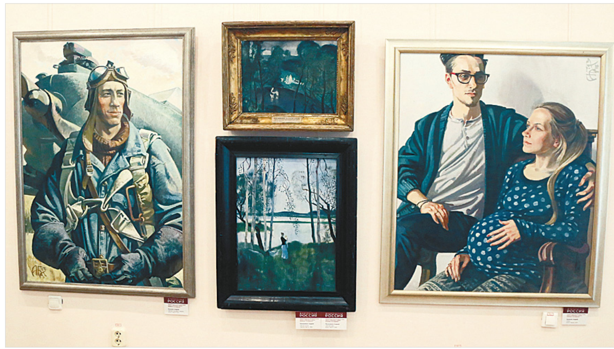
В залы «Золотой коллекции» временно пришли «Суровый стиль» и «Ленинградская школа живописи».

Ольга МЕТЕЛКИНА.