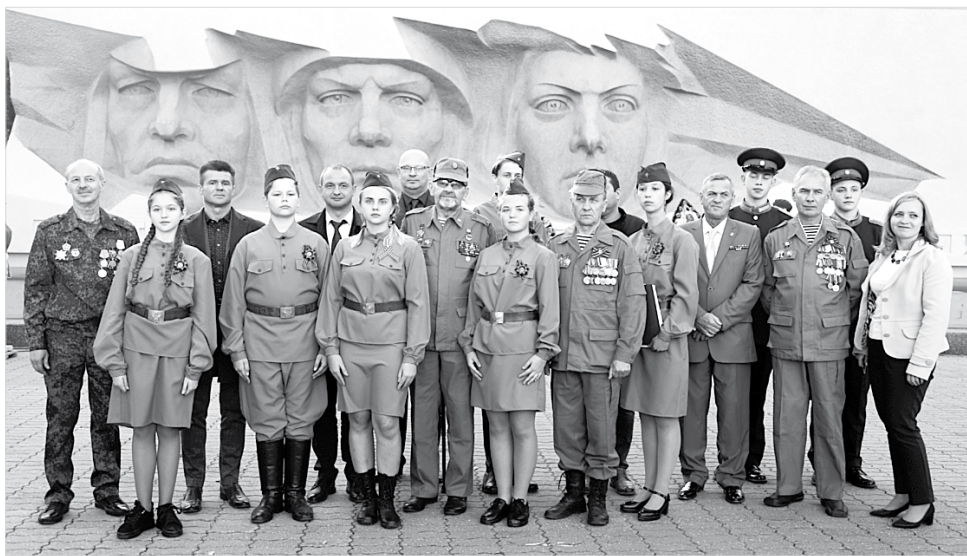
Фото перед поездкой.

Визит нашей делегации в Армению проходит в рамках акции «Победа сближает народы», и посвящена она 75-летию Победы советского народа над фашистской Германией. Народа, бывшего когда-то единым. Плечом к плечу на фронтах Великой Отечественной сражались люди разных национальностей и отдавали жизни за Родину, которая тогда тоже была на всех одна. И даже после того, как в 1991-м мы «разъехались» по разным национальным квартирам, люди помнят своих героев и гордятся ими. Точнее — помнят нормальные люди, вменяемые. Потому что и у нас, и в республиках