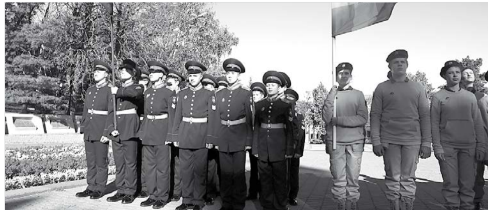
В митинге принимали участие кадеты.